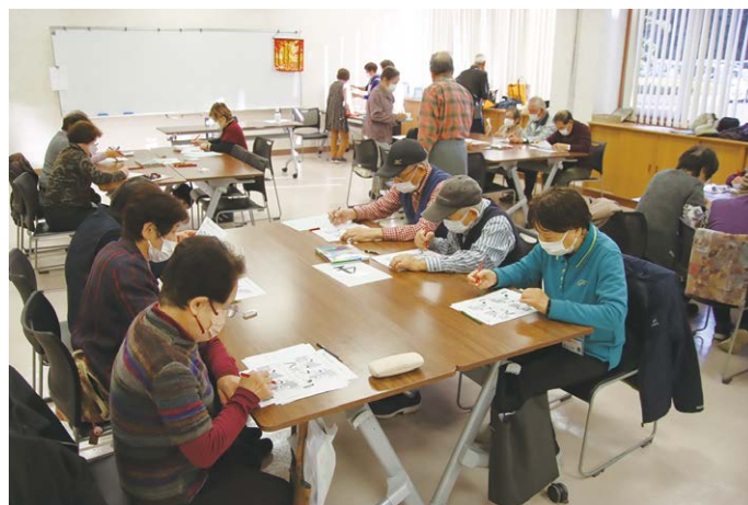
発酵カフェ（認知症カフェ）

ボランティアセンター機能 10 を活用し、既存団体の強化と新たな担い手の育成を進めます。世代を問わず参加できる活動環境を整え、地域福祉の担い手づくりを推進します。