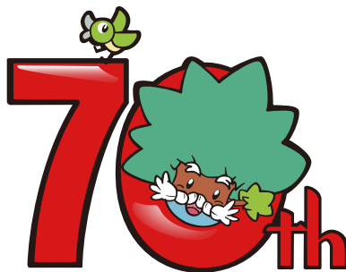
なんじゃもん70周年記念ロゴマーク

要望や意見の収集は行われていますが政策反映の仕組みが十分ではありません。得られた意見を行政運営に反映する体制強化が求められます。