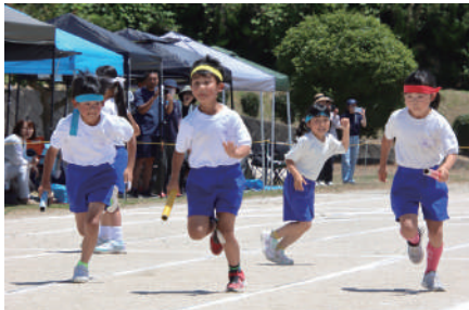
▲全力で駆け抜けた紅白リレー