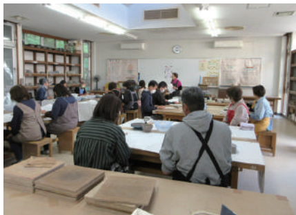
▲講師から陶芸のコツを教わりました