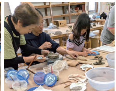
▲家族で協力して制作！