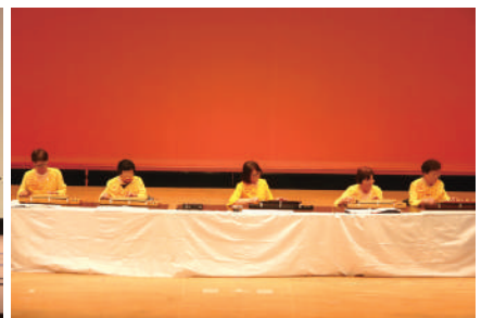
▲大正琴の美しい旋律