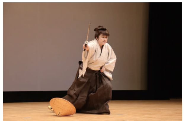
▲伝統文化の魅力を伝える日本舞踊