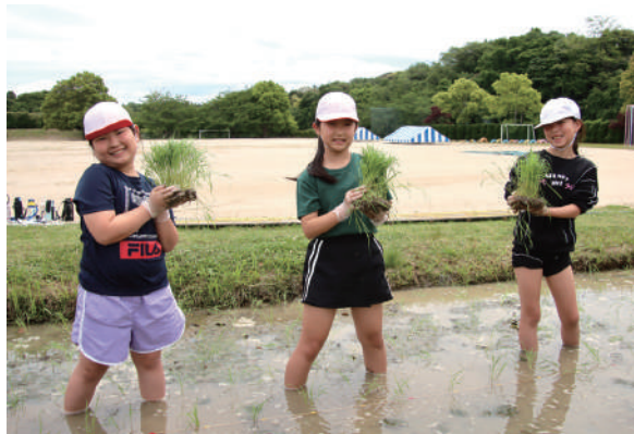
▲苗を手に笑顔を見せる子どもたち