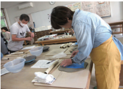
▲力を入れて土を捏ねます！

陶芸の楽しさを知り、さらに中級の陶芸教室にも参加したいと意欲のある皆さんでした。