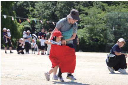
▲お父さんお母さんと一緒に頑張りました！