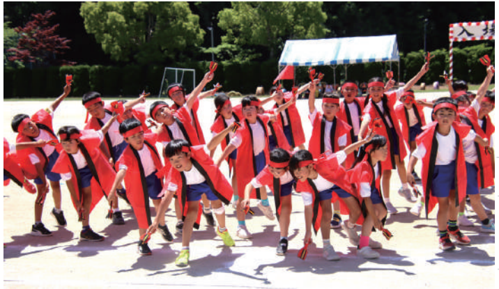
▲全校児童が元気よく踊った「よさこいソーラン」

よさこいソーランでは、児童たちが息の合った踊りを披露し、大いに盛り上がりました。