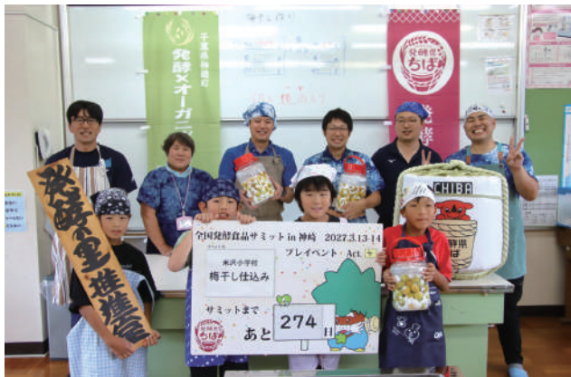
▲神崎町の梅で作った梅干し、完成が楽しみです！