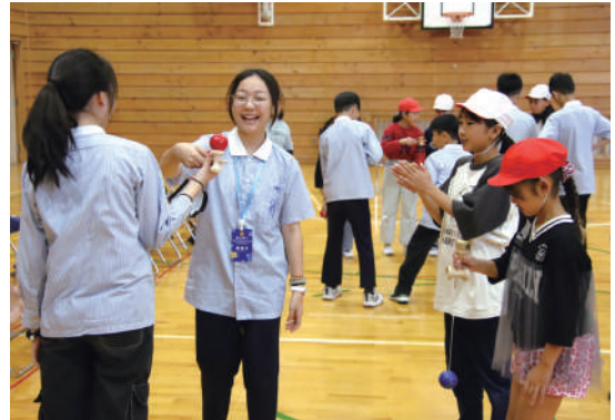
▲けん玉を成功させ、笑顔いっぱい！

交流活動では、けん玉や折り紙、玉入れ、ドッジボールなどを通して親睦を深め、子どもたちは言葉や国境を越えて笑顔で交流し、友情を育んでいました。