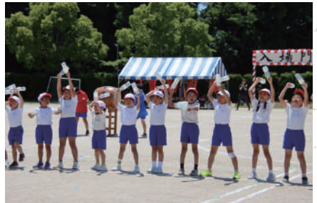
▲力いっぱい声を出した応援合戦