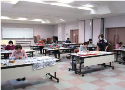
▲着物文化を次世代につなぐ教室