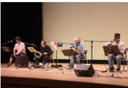
▲TFVIによるバンド演奏