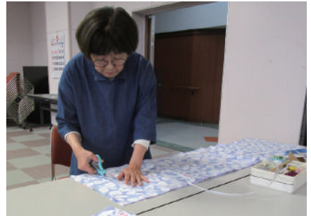
▲思い出の着物に新たな命を吹き込む