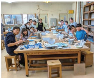
▲笑顔いっぱいの親子教室

今年度は、陶芸、ユニカール、クリスマスリースづくり、藍染の体験をします。1回目の陶芸は、親子で話し合いながら、素敵な作品を作りました。