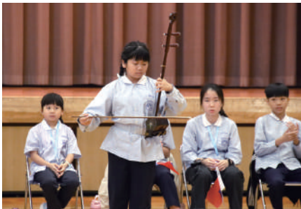
▲民生國民小学の二胡演奏