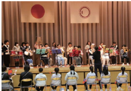
▲金管部による校歌の演奏