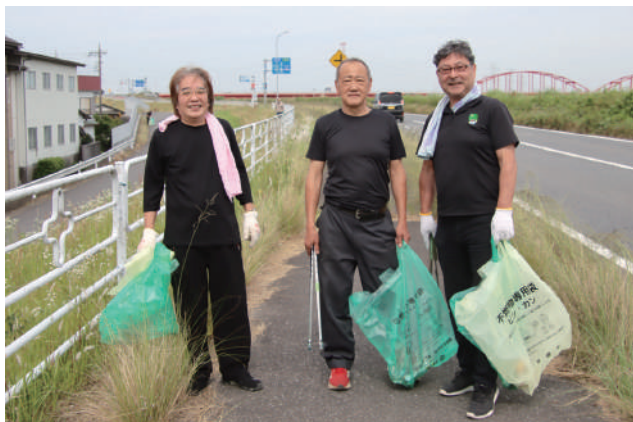
▲みんなで協力して地域をきれいに！（本宿地区）