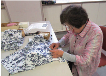
▲一針一針に思いを込めて