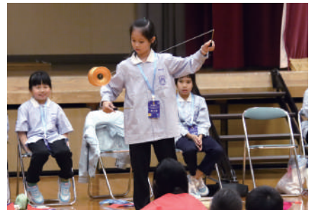
▲華麗な技を見せた中国ゴマのパフォーマンス