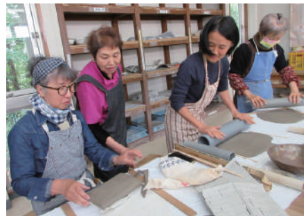
▲個性あふれる器を創作！