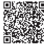
国外財産調書制度