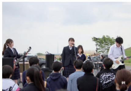
▲観客を引き付ける高校生バンドのライブ