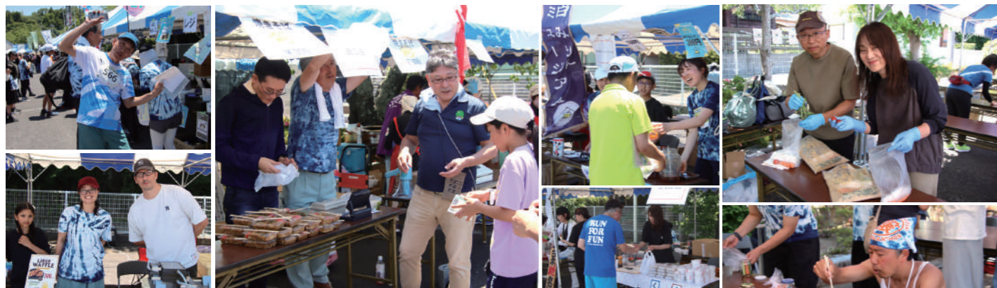
▲笑顔あふれる会場の様子