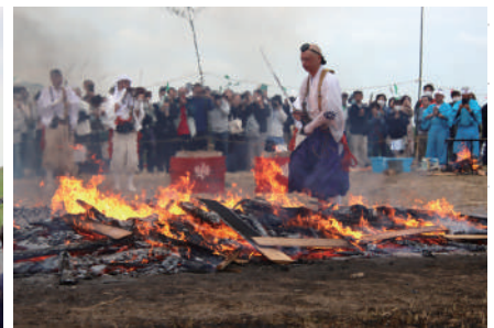
▲燃え盛る火の中を渡る山伏姿の修行僧