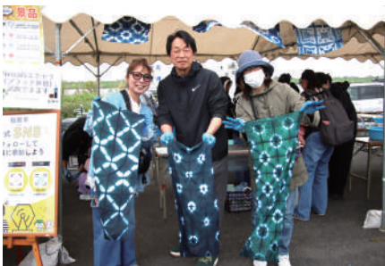
▲自分で模様つけをした世界に1つの藍染め手ぬぐい

神崎寺の伝統行事「火渡り修行」では山伏姿の修行僧が燃え盛る炎の中を裸足で駆け抜け、無病息災を祈念しました。