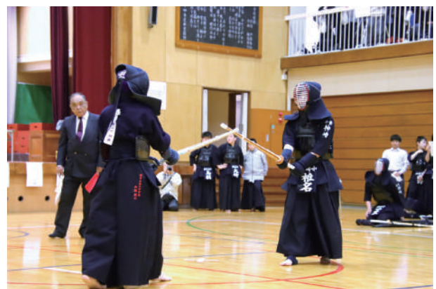
▲互いに間合いを測り、緊張感が高まる一瞬

選手たちは一戦一戦に全力で挑み、日頃の稽古で培った技と精神力を存分に発揮し、気迫あふれる試合が繰り広げられました。