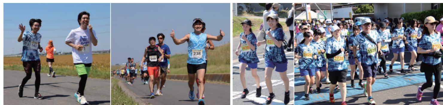
▲地域の景色を楽しみながら笑顔で走るランナーの皆さん