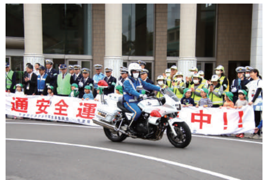
▲園児たちに見送られる白バイ

式典終了後には、白バイやパトカーなどの車両が隊列を組んで出発し、会場に集まった多くの来場者に見送られながら、地域の交通安全を呼びかけました。