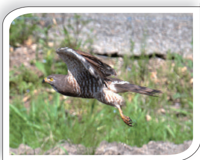
▲カエル、ヘビ、トカゲ、昆虫などを食べている

昨年は神崎町でも4羽にGPS発信器が装着されました。この4羽は、秋に旅立つと沖縄本島、奄美群島の徳之島、3000kmほど離れたフィリピン・バタン諸島で冬を過ごし、春に再び神崎町を目指してくることが明らかになりました。まさに命がけの大移動です。温かく見守りたいものですね。