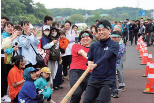
▲今年も大盛り上がりの綱引き対決

利根川河川敷を会場に「神崎河川敷祭」～こうざきリバーサイドフェスティバル～が開催されました。