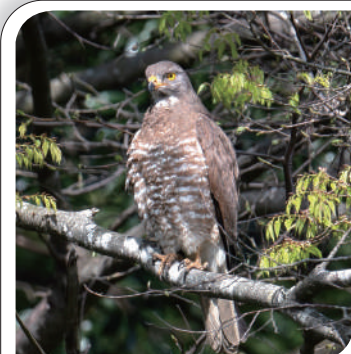
▲里山を生活圏にする猛禽（ワシ・タカ）の仲間

そこで『国際サシバサミット』を運営する日本のNGO 5団体が、3年前から渡りの全容解明調査に乗り出しています。