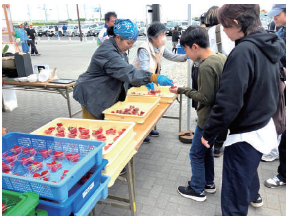
▲大盛況のいちごの無料配布

当日は、毎年恒例の甘酒・鯉こく・いちごの無料配布に加え、焼きそばやさつまいもスティックなどの販売が行われ、家族連れなど多くの来場者で活気にあふれました。また、地域の特産品にも触れられる機会となり、会場は終日、和やかな雰囲気になりました。