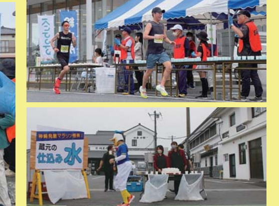
▲鍋店(株)が提供する仕込み水