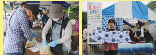
▲我が家のぬか床の完成 ▲オリジナル藍染め手ぬぐい