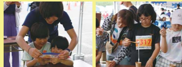
▲おいしい醤油糰になあれ！ ▲モッツアレラチーズを体験！