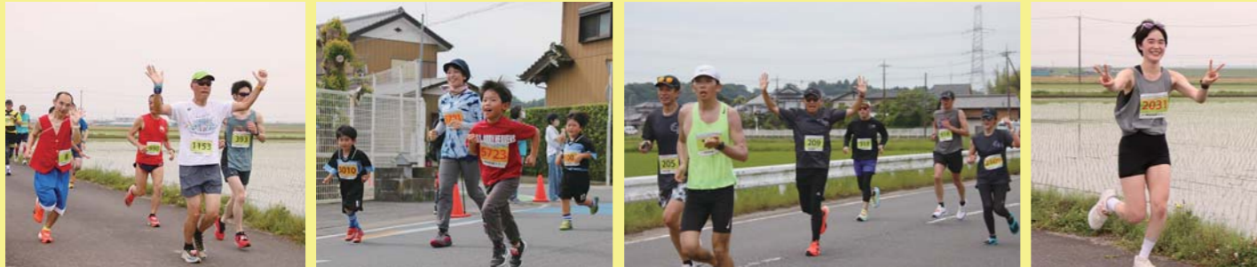
▲コスプレや藍染めTシャツなどさまざまな服装で参加し、笑顔で走ったランナー