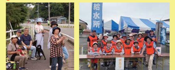
今年も大勢のボランティアスタッフや近隣住民の方々にご協力いただきました。ありがとうございました。