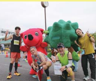
▲チーバくんやなんじゃもんちと記念撮影