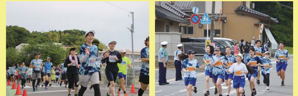
▲子供から大人までオリジナル藍染めTシャツを身に付けて、神崎町を駆け抜ける！

今大会の参加賞も第1回大会から続く藍染めTシャツで、今回も多くの方が身に付けて参加してくれました。