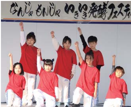
ビシッと決まったキッズダンス

糰、味噌、乳酸菌など「発酵」にまつわる出店が軒を連ねたほか、商工会女性部の100杯限定のホットチョコレート、地元農作物の販売などが行われ、会場は多くの来場者で賑わいました。