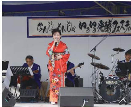
生バンドによる歌謡ショー