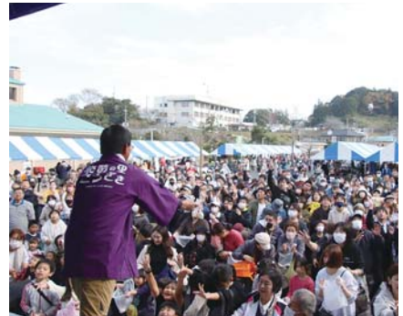
大盛況のもちまき!