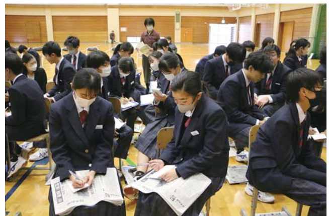
お互いをインタビューする神崎中の生徒たち