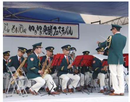
成田市消防音楽隊オンステージ