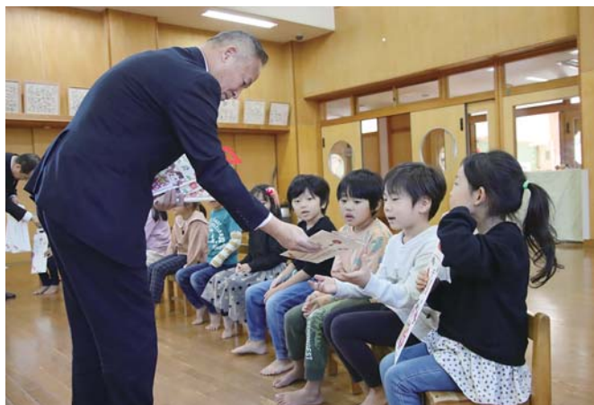
椿町長から記念品を受け取る園児たち

22日には式典が行われ、町長からお祝いの言葉と、記念品の千歳飴とクレヨンが贈られました。