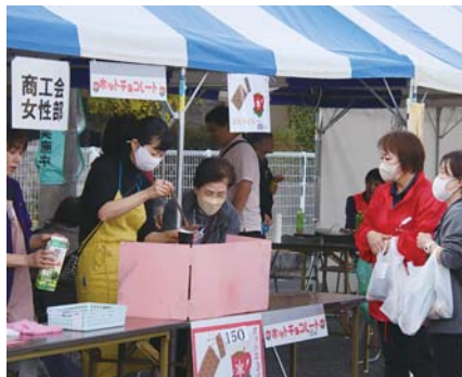
大人気のホットチョコレート