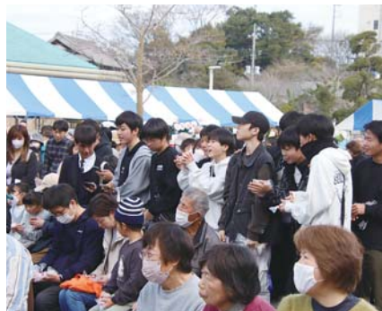
当選するかワクワクの大抽選会