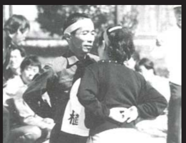
混沌を極めた「逃げる玉入れ」 ■ お気に入りのパンを狙って「パン食い競走」 ■ お願い! 真っすぐ進んで! 「輪っば廻しリレー」 ■ 一輪車を押して! 「ボール運びリレー」 ■ 地区の俊足たちが揃う「世代交代リレー」 ■ 二人の間にボールをはさんで「危険な関係リレー」