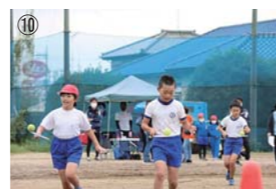
⑤選手宣誓で会場を盛り上げた神崎中の美少女戦士 ⑥大人も子供も全力疾走(スウェーデンリレー) ⑦「なんじゃもん」もスウェーデンリレーに参加! ゴール直前で最下位に転落 ⑧各部対抗の消防団員リレー(600m部対抗リレー) ⑨親子で障害物を越えていけ! (親子競技) ⑩ラケットの上のボールを落とさないように(バランスボール)