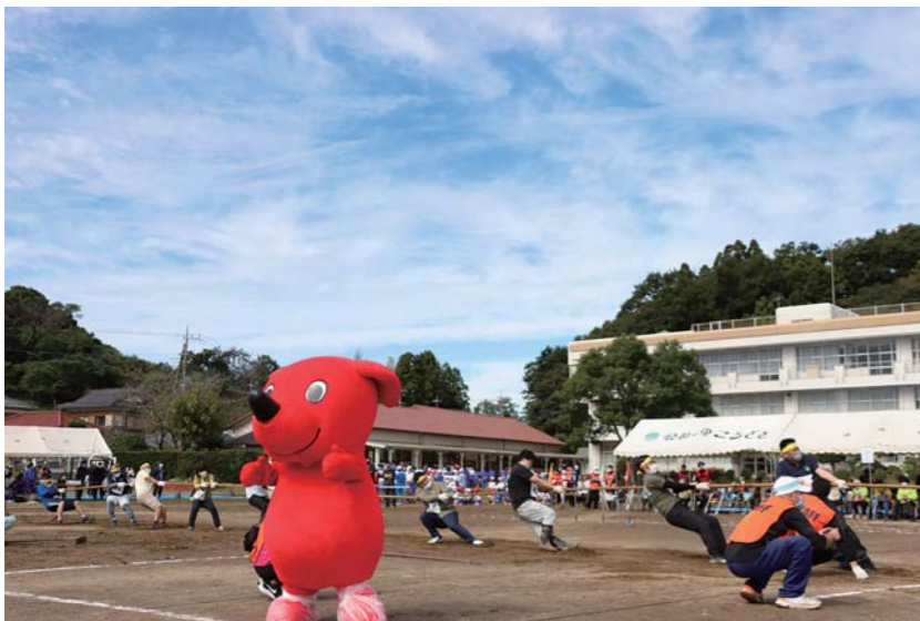
▲千葉県のマスコットキャラクター「チーバくん」も綱引きを応援してくれました! (綱引き)

①道着で走るスウェーデンリレー ②ボールを上手くコーンに当てよう! (先生…バスケがしたいです) ③縄が少し短い!? 思わず笑顔(中学校女子障害物競走) ④じゃんけんに勝つまで通れない(じゃんけんPON)