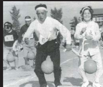
地区の子どもをかごに乗せてリレー「お猿のかごや」 ■ まっすぐ、急がず、転ばずに「紙袋競走」 ■ 「ファッションスタイル競走」 ■ こんな時代もありました「喫煙リレー」 ■ 弾ける炭酸に悪戦苦闘「ラムネ早飲み競走」 ■ お尻の圧で勝負! 「けつ圧競走」 ■ ぴったり息があった「ペンギン競走」