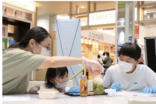
好きな野菜をたくさん詰めて（ビネガーラボ）

午前はお酢を使ってフルーツビネガーとピクルスを作る「ビネガーラボ」。午後は藍染でTシャツを染める「ジャパンプルー」の2本立て。色とりどりの野菜を瓶に詰めてピクルス液を注げば、見た目も華やかなピクルスの完成！藍染講座ではオリジナルの模様をつけ、藍染液を洗い流し模様があらわれると大歓声が起こりました。