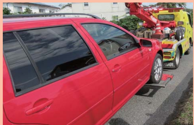
自動車の差押えの様子

▶問合せ 千葉県香取県税事務所 ☎0478-54-1314 千葉県総務部税務課 ☎043-223-2127