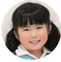
いのり あいる 禰 愛心ちゃん (四季の丘)