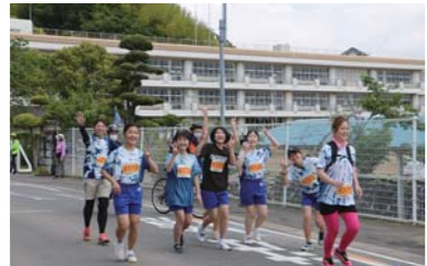
▶2kmに出場した神崎中学校の生徒たち