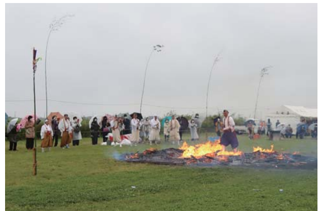
燃え盛る火の中を渡る山伏

神崎寺の伝統行事「火渡り修行」ではあいにくの雨となりましたが、山伏が燃え盛る炎の上を裸足で駆け抜け、無病息災を祈念しました。