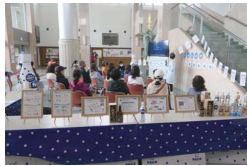
▲乳酸菌勉強会を開催するアサヒ飲料