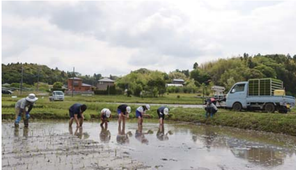
目印が付いたロープに沿って横一列で田植え