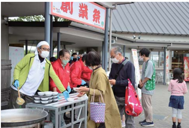
おなじみとなった鯉の味噌汁「鯉こく」

当日は道の駅出品者協議会から甘酒と鯉こくが無料で配布されたほか、朝に町内で収穫された苺が配られ、来場者を楽しませていました。