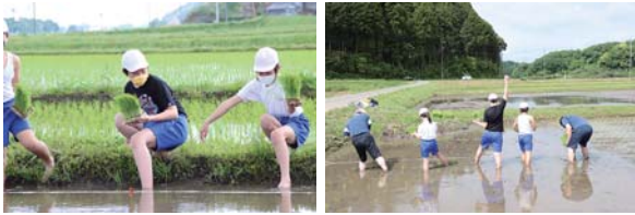
左 水が冷たくてびっくり！ 右 あともう少し！頑張るぞー