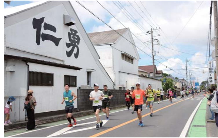
▲鍋店神崎酒造蔵の前を通過するハーフマラソンのランナー

ボランティアの数 約350人! 交通整理や給水所、会場内で多くのボランティアに参加していただきました