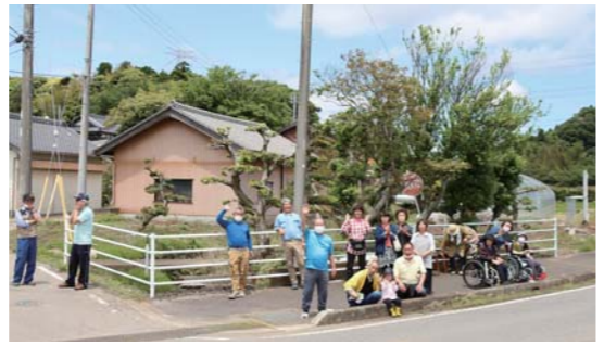
▲沿道から声援を送る大応援団!(小松)