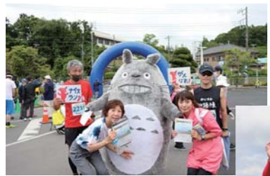
◀コスプレランナーも多数参加し大会を盛り上げる

大会記念Tシャツ 町職員とボランティアで染めたオリジナル藍染Tシャツ。たくさんのランナーが着用して走ってくれました。