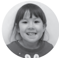
グラスメリーレー GLASS MARY LEちゃん (四季の丘)