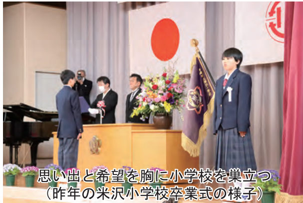
思い出と希望を胸に小学校を巣立つ (昨年の米沢小学校卒業式の様子)