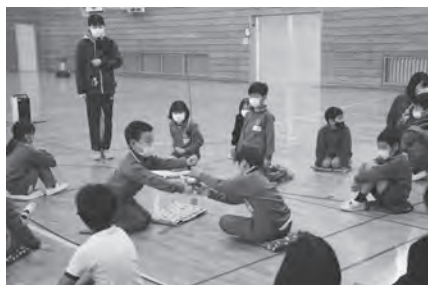
競技に使う剣を持たせてもらう

講師による競技説明の後、東京都車いすフェンシング協会所属選手によるデモンストレーションが行われ、間近に見るフェンシングの迫力に児童たちはびっくり！代表の児童と選手による模擬体験は実際の防具を付けて行われ、応援する児童から大きな声援が送られました。