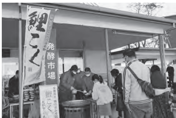
大人気の鯉のみそ汁「鯉こく」

抽選会は道の駅出品者から提供頂いた景品により実施され大盛況。1月の寒空の中、温かい甘酒と鯉こくの配布には多くの人々が足を止め、冷えた体を温めていました。