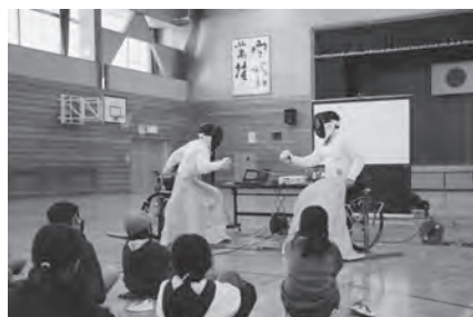
迫力のデモンストレーション！