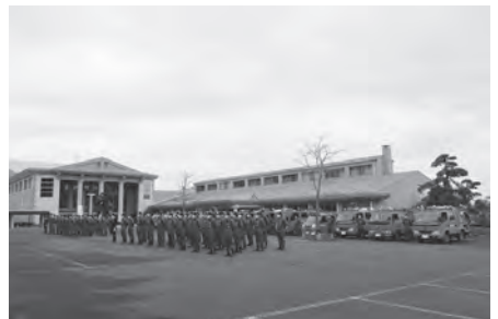
消防車両13台が集合