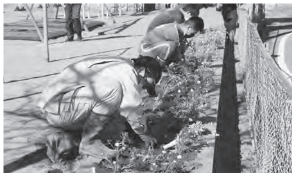
ポットで育てた花を花壇へ植える