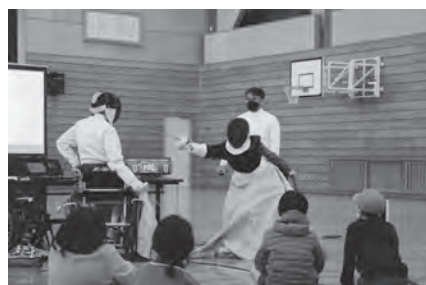
スピーディーな剣さばき