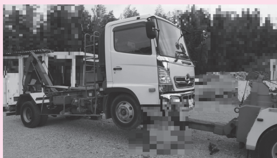
差押え自動車の引き上げ

▶問合せ 千葉県香取県税事務所 ☎0478-54-1314 千葉県総務部税務課 ☎043-223-2127