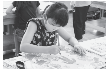
作っているのはエジプトの世界遺産！ 講師のアドバイスで作品に躍動感が生まれる 一日がかりで作品を仕上げる