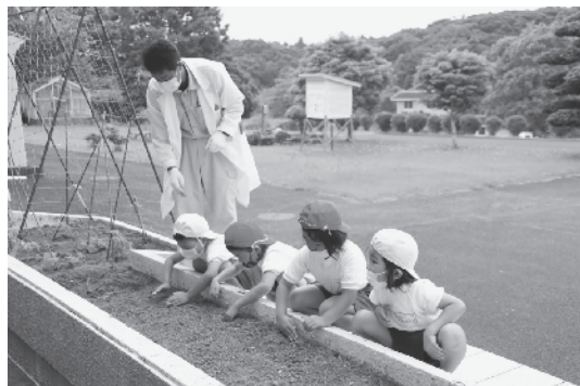
落花生早く大きくなーれ！