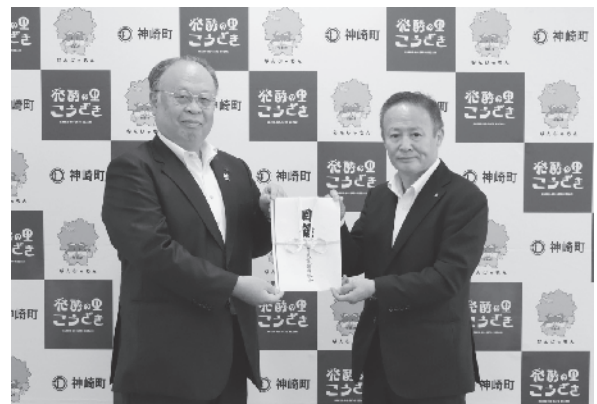
武田組合長(写真左)より目録を受け取る榎町長

町内小学校の5年生に配布し、授業の中で有効に活用させていただきます。ありがとうございました。