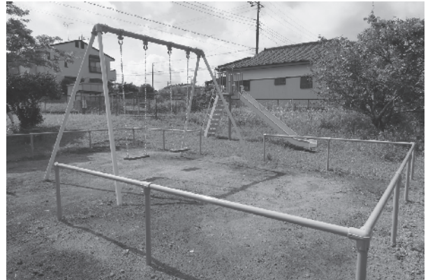
新設したブランコとすべり台

宝くじの助成金により安全で楽しく遊べる遊具を設置することで、体力作りやコミュニケーションの場として地域の交流が深まることが期待されます。