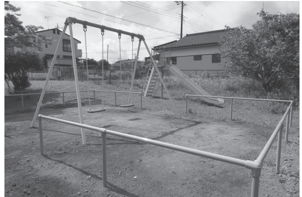
新設したブランコとすべり台

宝くじの助成金により安全で楽しく遊べる遊具を設置することで、体力作りやコミュニケーションの場として地域の交流が深まることが期待されます。