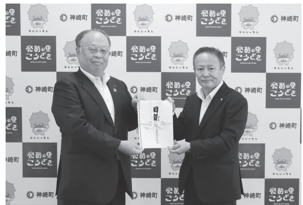
武田組合長(写真左)より目録を受け取る榑町長

町内小学校の5年生に配布し、授業の中で有効に活用させていただきます。ありがとうございました。