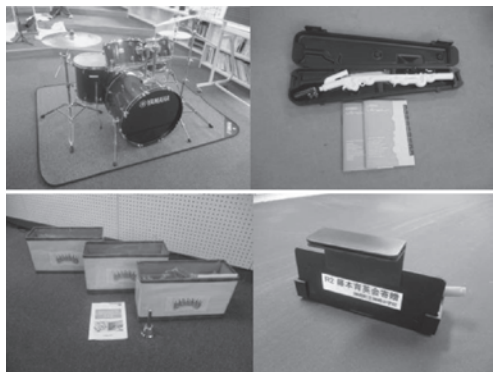
寄贈されたドラムセットとヴェノーヴァ、ミュージックベル、譜面ラック

楽器等(ドラムセット、ミュージックベル27音セット3セット、譜面台ラック20台、ヴェノーヴァ1器)