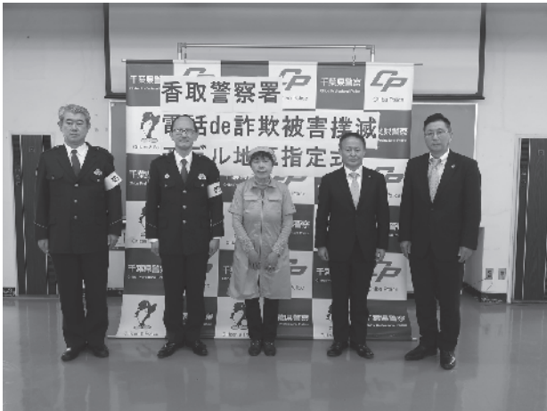
電話de詐欺被害撲滅モデル地区指定式

モデル地区へは、警察官が特別巡回（個別訪問）を実施し、留守番電話設定を始めとした防犯指導等を行います。自治会、香取警察署、神崎町で連携し、被害が発生しにくい環境づくりを推進します。