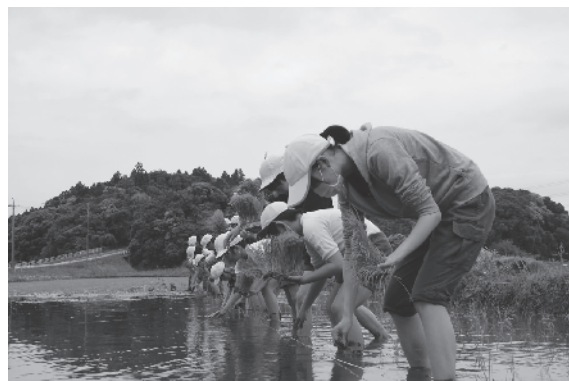
目印に沿って丁寧に苗を植えよう！

児童たちは恐る恐る田んぼに入ると、「冷たい！」と大歓声！紐につけた目印に沿って、みんなで1列になって田植えができました。