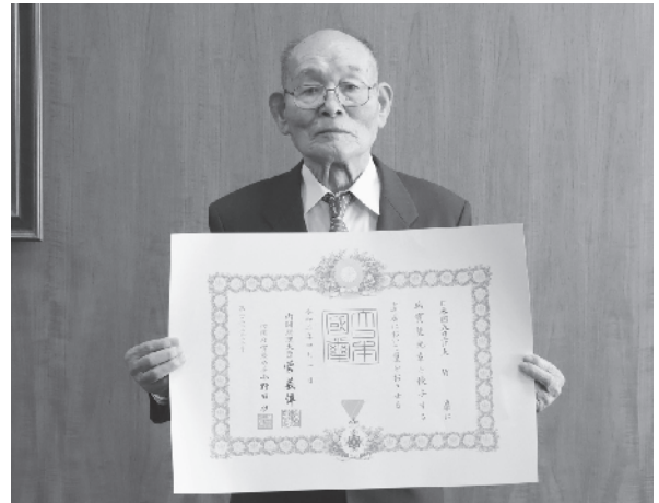
この度の受章、おめでとうございます。

特別職在職中は、社会福祉協議会の法人化、神崎保育所の移転改築、こうぎ自然遊歩道の整備、古原浄水場の建設、神崎小学校の移転改築など、現在の神崎町の基盤づくりに尽力されました。