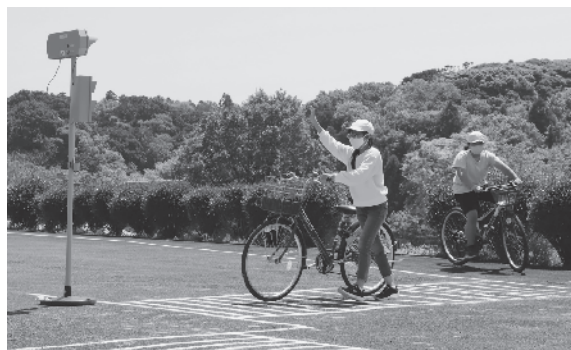
横断歩道は自転車を降りて歩いて渡ろう！

高学年の部では自転車の乗り方を学習しました。自分が乗っている自転車を持参した児童たちは、自転車の安全点検を行い、校内の模擬コースを走って練習することができました。