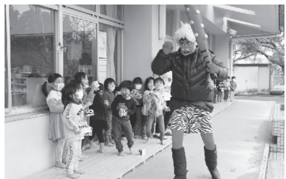
子どもたちの全力の豆まきに 鬼もたまらず退散！（米沢保育所）

子どもたちは節分にまつわる紙芝居を読み、保育所に現れた大きな鬼に「鬼は外！福は内！」と元気よく豆まき。怖い鬼と一緒に、自分の中に「隠れている鬼」も退治することができました。その後、福の神からお守りやお菓子が振舞われ、泣いていた子どもにっこり笑顔に！米沢保育所では、おやつ時間に七輪で焼いたイワシを食べ、節分行事を満喫しました。