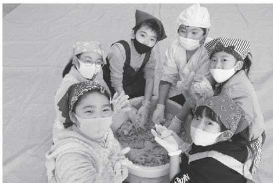
美味しくな一れ！ の合言葉で楽しく味噌仕込み

当日、体育館で行われた体験授業では、味噌仕込みの曲に合わせてワイワイ楽しく仕込み作業ができました。みんなで協力して仕込んだ味噌は1年後に完成。美味しいお味噌になりますように！