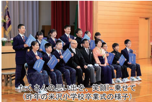
たくさんのお思い出を、笑顔に乗せて (昨年の米沢小学校卒業式の様子)