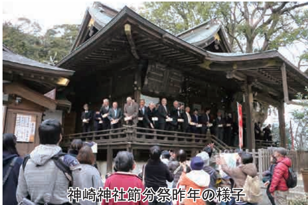
神崎神社節分祭昨年の様子