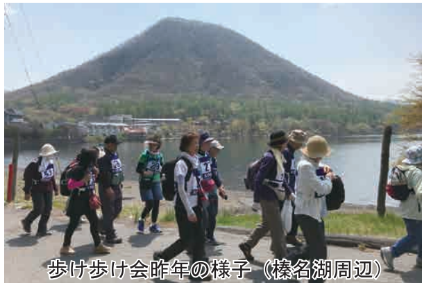
歩け歩け会昨年の様子（榛名湖周辺）