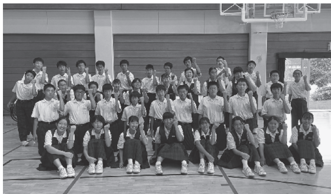
オレンジリング(受講終了の証)をつけて記念写真

日々の生活の中でよく笑い・他者と話をし、3食しっかりと食事をとることが大切です。