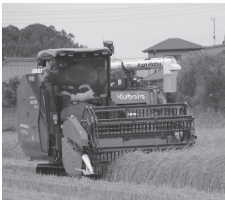
ロボットコンバインに乗るなんじゃもん

北総地域の豊かな米どころとして、昔から米作りが盛んな神崎町。近年、農家の高齢化や農業の担い手不足により、農家自らが耕作できない農地が増えています。その問題を解決するのが「スマート農機」たち！国の「スマート農業実証プロジェクト」に採択され、実証実験を行う農事組合法人神崎東部の取組を紹介します。