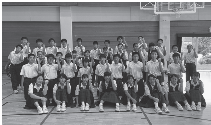
オレンジリング(受講終了の証)をつけて記念写真

日々の生活の中でよく笑い・他者と話をし、3食しっかりと食事をとることが大切です。