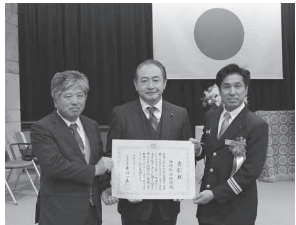
国土交通副大臣と