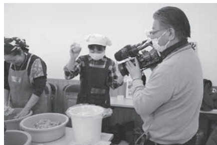
左：空気を抜いて団子を作ります 中：家族で仕込むみそは特別！ 右：上手に樽の中に投げ入れる