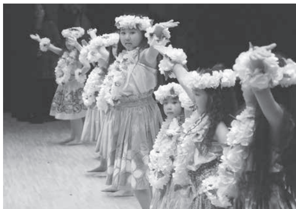
フラガールによるハワイアンフラメドレー