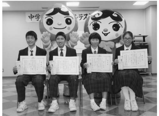
この度の受賞、おめでとうございます。