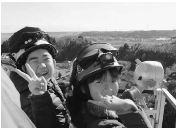
はしご車に乗って地上40mの高さから町を見渡す