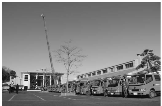
消防車のサイレン鳴り響く機械点検