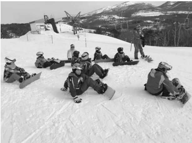
今年度から始まったスノーボード教室

当日は天気にも恵まれ、ゲレンデもいい状態でレッスンを受けることができました。最初は慣れずに苦戦していましたが、レッスンが進むにつれて上達し、最後はしっかり滑れるようになりました。