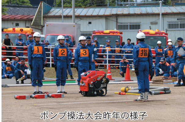
ポンプ操法大会昨年の様子