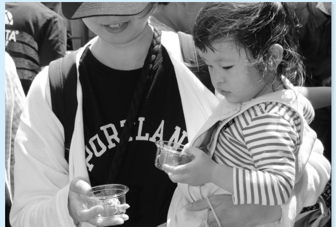
新鮮ないちごをもらったよ