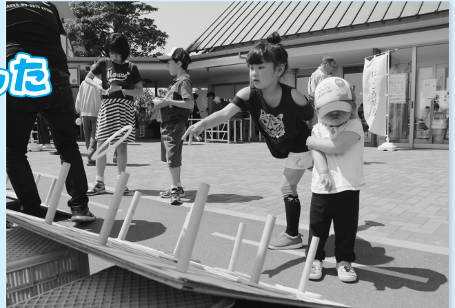
大人気の輪投げにチャレンジ