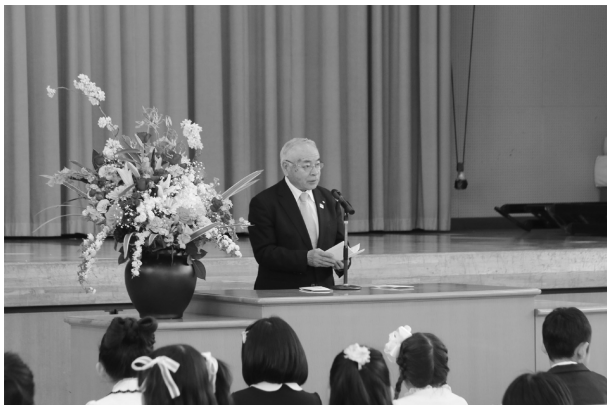
神崎小学校入学式