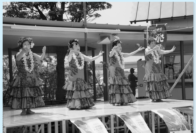
創業祭を盛り上げる文化協会のステージ