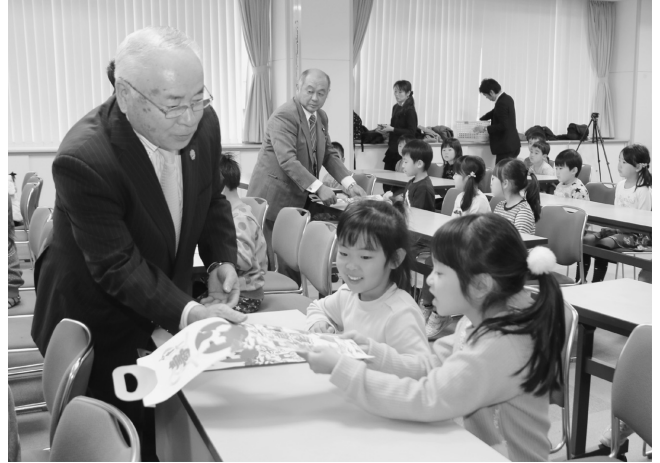
子ども達へ千歳飴やクレパスが手渡される

式典終了後には、人形劇団ぱびぷべぼ劇場による人形劇「のそのそによろよ」を楽しく鑑賞しました。