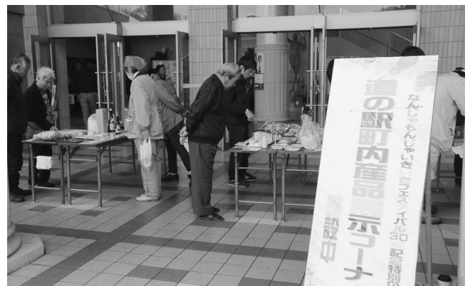
第30回記念特別企画の道の駅産品展示