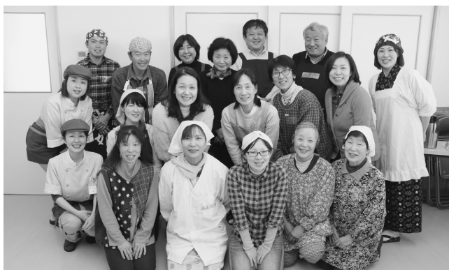
皆で手前みその歌に合わせて踊り、 楽しい講座となりました