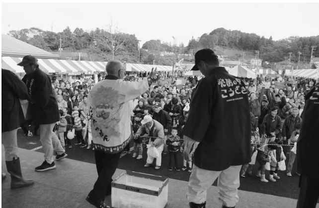
大人気の稲作研究会による餅まき