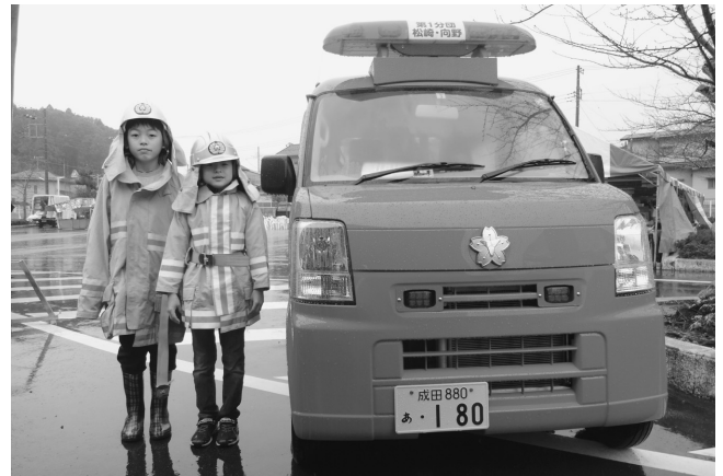
消防車の前で記念撮影