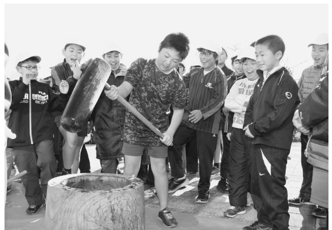
レース後のお餅は格別です！（米沢小学校）

米沢小学校は、12月7日に校内を周回するコースを走り、練習の成果を出し切る見事なレースが繰り広げられました。また、レース終了後は皆で餅つきを行い、つきたての美味しいお餅を食べました。