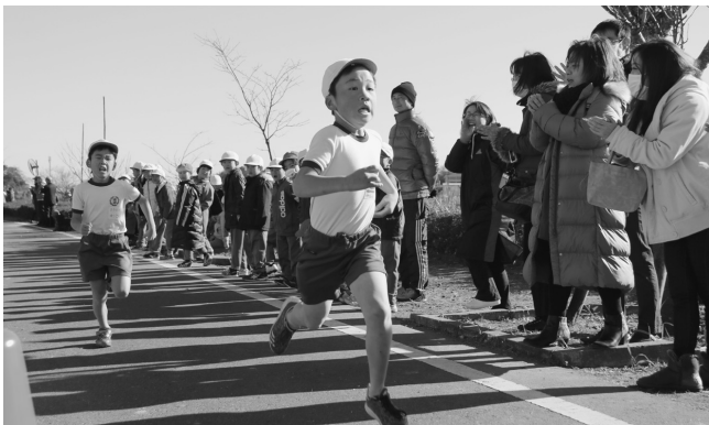
自己ベストを目指し、走り抜く！（神崎小学校）

神崎小学校は、12月12日にこうざき天の川公園周辺を会場として、学年ごとに決められたコースを全力で走り抜ぬけました。