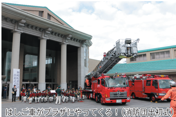
はしご車がプラザにやってくる！（消防団出初式）