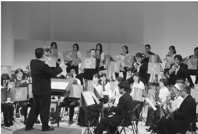
ホールにクリスマスソングが響き渡る