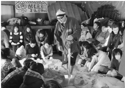
▼酵素風呂足湯【(株)寺田本家】