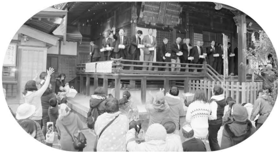
たくさんの方々が集まる (神崎神社)

2月3日、神崎神社で節分祭が、神崎・米沢の両保育所では豆まきが行われました。神崎神社の節分祭には、年男や氏子代表が福豆を投げ、会場には多くの人々が訪れました。保育所の豆まきでは、小さい子たちが鬼に怖がりながらも「鬼は外!」の掛け声で元気に豆を投げ、見事鬼を退治しました。