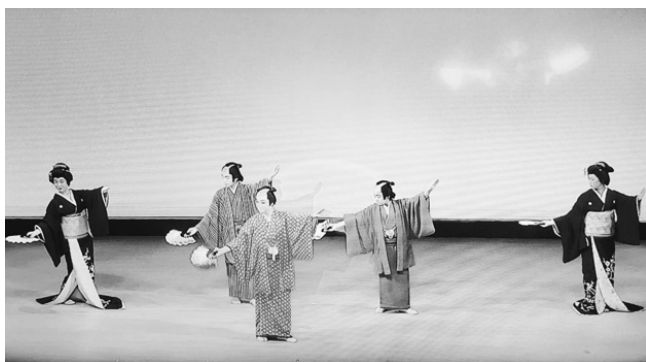
歌謡舞踊ショーで見事な舞