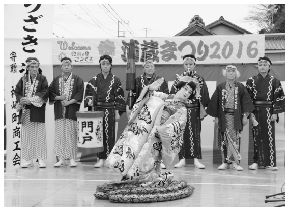
▲華やかなステージイベント

※規制期間は上記のとおりですが、規制期間前後は、準備・片付けの関係上路上が混み合うため、迂回をお願いする場合があります。