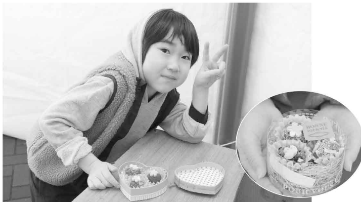
バレンタイン仕様のかわいいみそ玉ができました