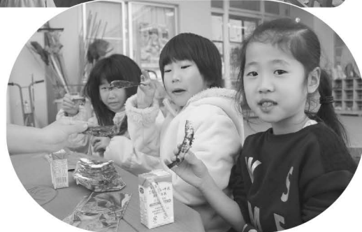
おやつにいわし(めざし)を食べました(米沢保育所)