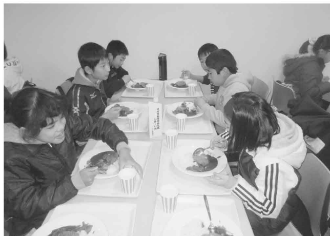
学食で日体大名物のカツカレーの昼食

当日は学食での昼食や様々な体育施設の見学などを行い、普段あまり目にすることのない大学生活を直接感じることができる貴重な体験となりました。