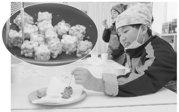
新しい神崎名物「てんぺ」を 炒めて試食