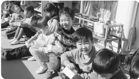
鬼は〜外っ! (神崎保育所)