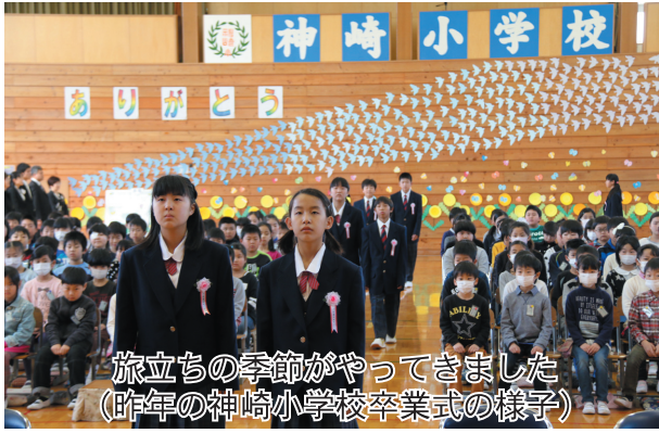
旅立ちの季節がやってきました (昨年(2016年)の神崎小学校卒業式の様子)