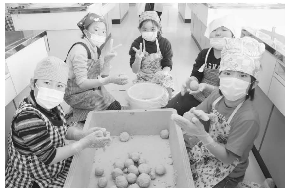
茹でた大豆、塩、糀を混ぜ丸めて樽に詰める

またこの日は、神崎産の大豆を使った「てんぺ」という発酵食品を試食。見るのも食べるのもほとんどが初めて!「あまい」「ほくほくしている」「おいしい!」と子ども達に大好評。「てんぺ」は、茹でた大豆をてんぺ菌で発酵させたインドネシアの納豆と言われる発酵食品です。発酵食品は大量の塩を使うものが多い中、「てんぺ」は塩分ゼロ!コレステロールゼロ!!の理想的な健康食品です。