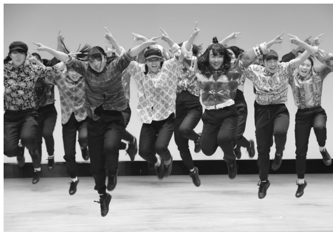
圧巻のパフォーマンス（千葉敬愛高校ダンス部）

神崎中学校の吹奏楽部、成田国際高校のダンス部、千葉敬愛高校のバトン部やダンス部、佐原高校軽音楽部のバンド演奏など、中高校生の力強いパフォーマンスのほか、子ども達のピアノ演奏やフラダンスなどたくさんの演目があり、会場は大いに盛り上がりました。