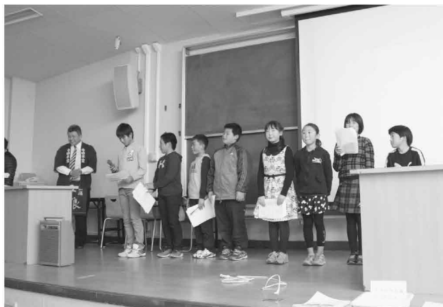
千葉大学の教室で発酵食品の発表を行う