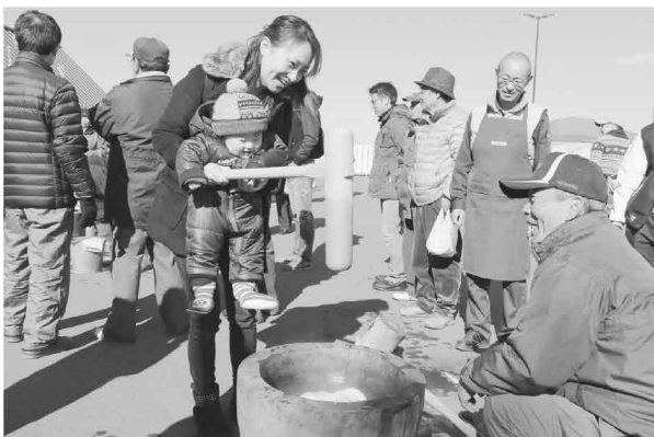
来場者が餅つきを体験

みそ玉作り体験では神崎の5種類の味噌を混ぜてみそ玉を作り、かわいい箱に詰めて完成。参加者は思い思いのみそ玉作りを楽しみました。