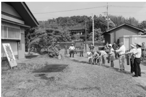
消防署員と郡消防団の指導で、消火器の使い方を確認しました