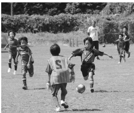
試合でキーパーと一対一の勝負！

ーにしています。選手がファウルをせず楽しくプレイできるよう、サッカーを通して体力面のみならず精神的にも子供を育てることを目指しています。