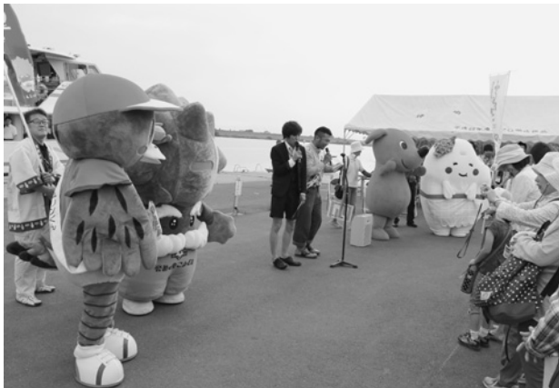
香取地域のゆるきゃらや千葉県住みます芸人 「ゴールデンボーイズ」が登場！