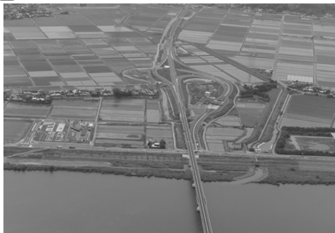
神崎IC上空写真