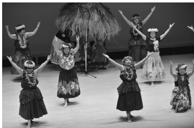
華麗なフラダンスで南国気分♪