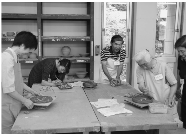
絵柄を描く時は集中が必要です