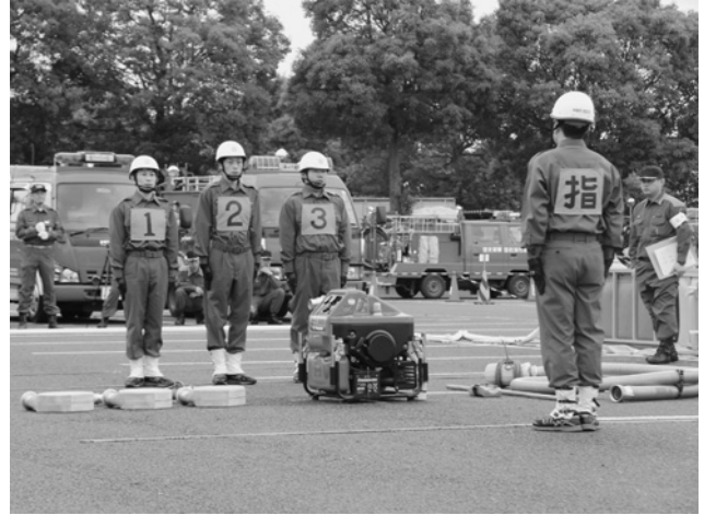
張り詰めた空気の中、開始の合図を待ちます