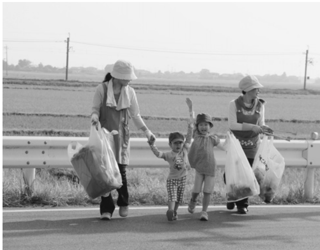
子ども達もお手伝い！