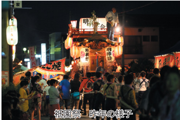
祇園祭 昨年の様子