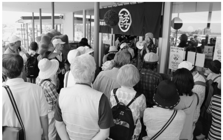
バスで道の駅「発酵の里こうざき」 にも立ち寄りしました