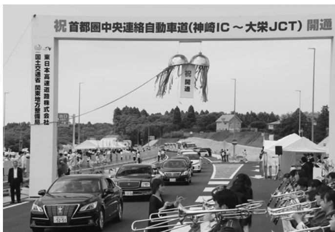
下総ICからの通り初め

その後、千葉県立成田国際高等学校吹奏楽部の華やかな演奏のもと、盛大に通り初めが行われました。