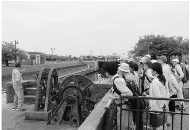
横利根閘門を見学し レクチャーを受けます