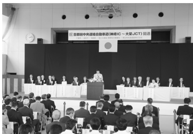
旧小御門小学校で行われた式典