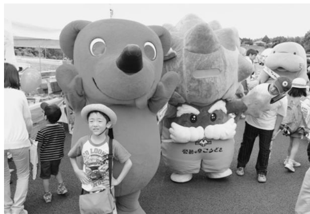
ゆるきゃら達が会場を盛り上げます