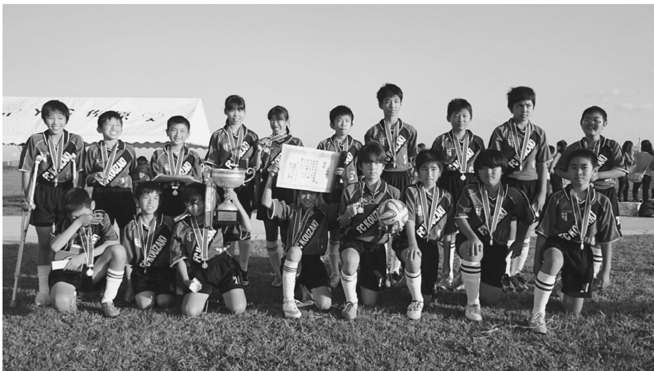
昨年の読売杯で優勝！