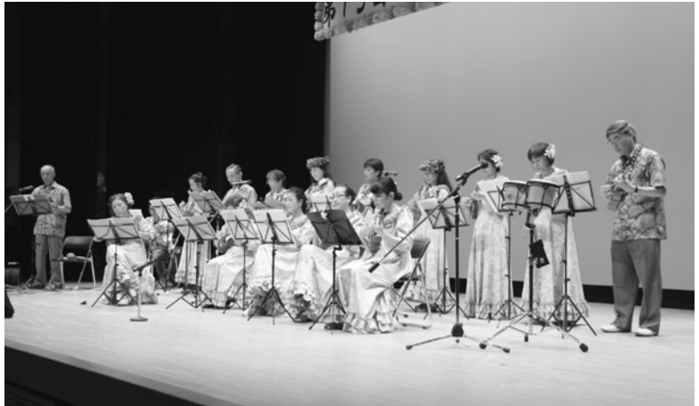
ウクレレ演奏で気分はハワイ旅行！？