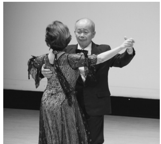
社交ダンスで魅惑のワルツ