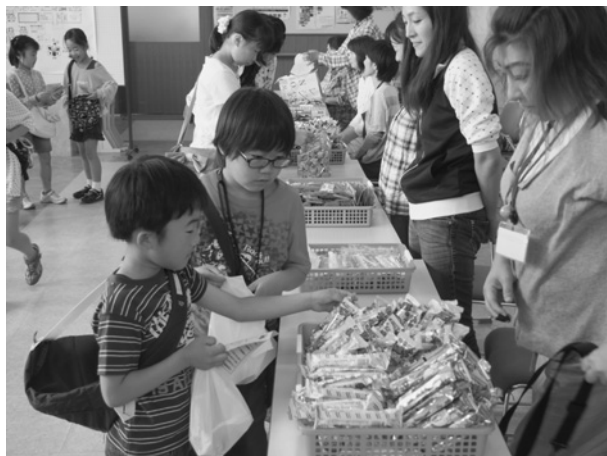
美味しそうなお菓子どれにしようかな～