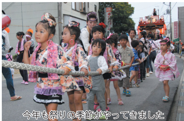
今年も祭りの季節がやってきました