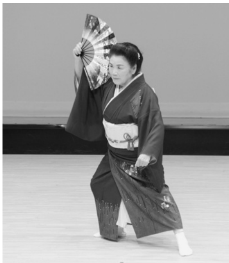
魅せます！南部蝉しぐれ