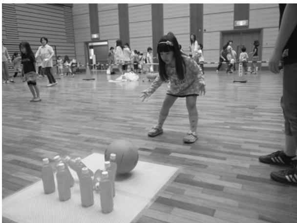
いっぱい倒れて！ペットボトルボウリング

6月8日、子ども会お楽しみ会が開催され、たくさん子ども達が集まりました。会場の神崎ふれあいプラザには、ヨーヨー釣りや輪投げなどのゲーム、お菓子やホットドックなどの食べ物が用意され、チケットを手にした子ども達は思い思いに会場を回って、楽しい半日を過ごしました。