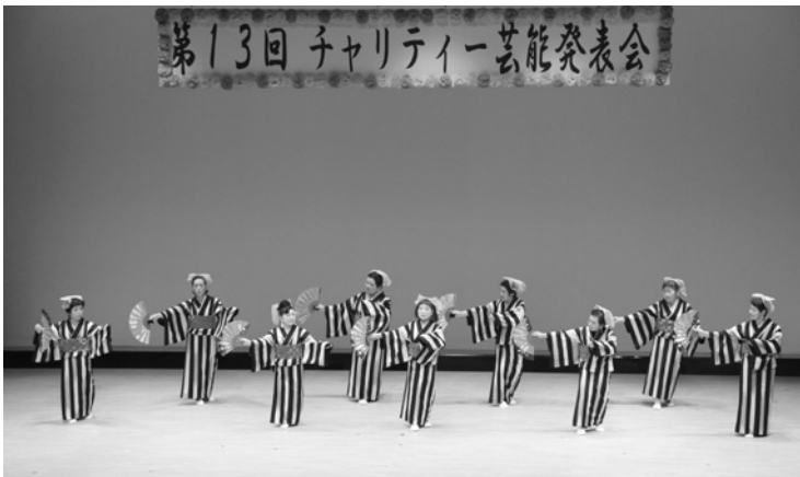
酔いましょ音頭で会場を盛り上げます