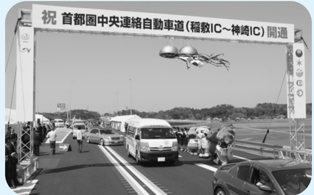
きらきら号が通り初めに参加