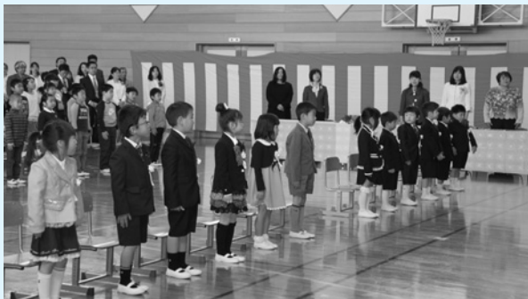
米沢小学校 (12名入学)