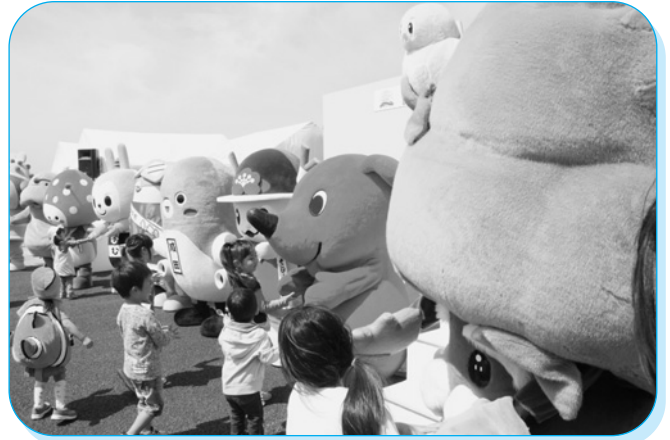
近隣市町村のゆるキャラ大集合

開通前の高速道路を歩くことができる最初で最後となる貴重な機会に、町内外から多くの参加者が訪れ、大変な盛況ぶりでした。できたばかりの真新しい道路から眺める雄大な利根川の眺めに多くの参加者が魅了されました。