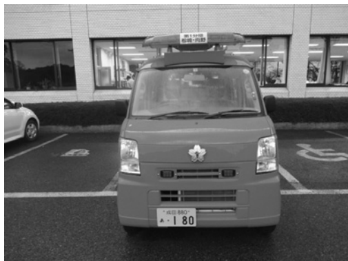
松崎・向野に配置された 小型ポンプ付軽積載車

神崎町消防団に消防庁の事業による資機材が無償貸与されました。神崎町消防団第1分団第6部（松崎・向野）の小型ポンプ付軽積載車をはじめとし、エアートントや簡易船舶・バルーン型投光機等が貸与され、3月23日には貸与資機材を利用した神崎町消防団による災害対応訓練が実施されました。