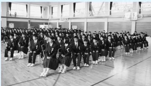
神崎中学校 (57名入学)