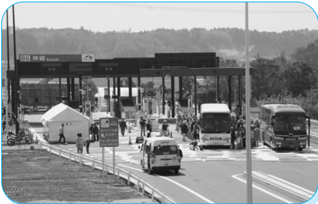
できたての神崎ICに集まるたくさんの参加者