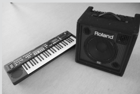
寄贈されたハーモニーディレクターとキーボードアンプ