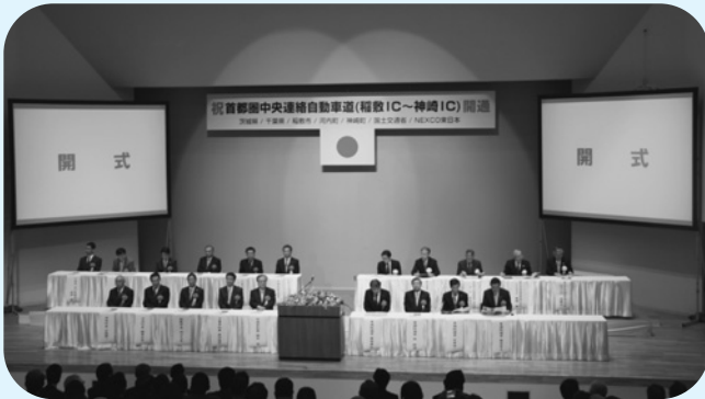
江戸崎公民館での開通式典の様子