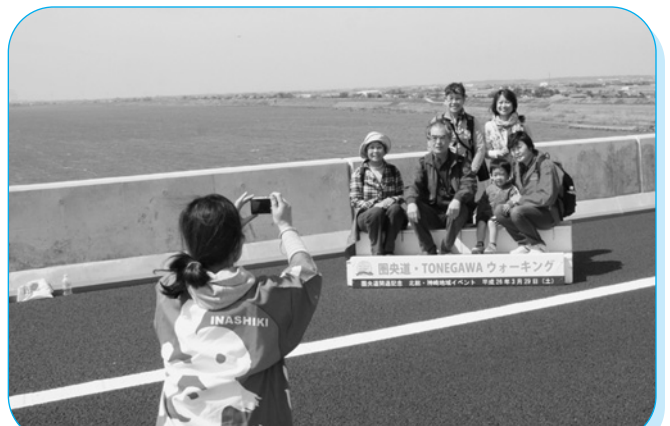
雄大な利根川をバックに記念撮影