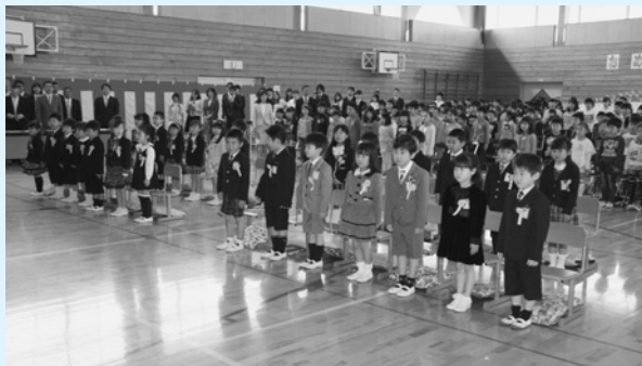
神崎小学校 (26名入学)