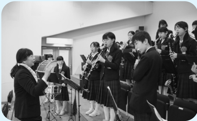
式典でウェルカム演奏をする神崎中学校ブラスバンド部