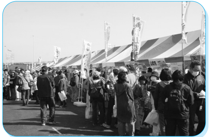
会場はたくさんの出店で大賑わい