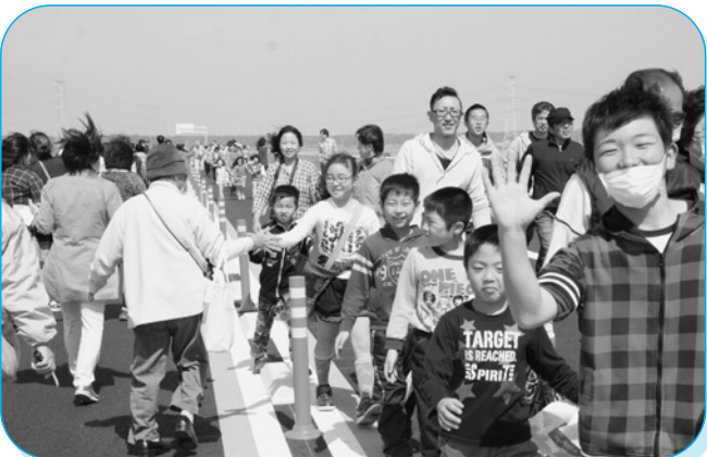
同時開催された稲敷市のイベント参加者とハイタッチ！