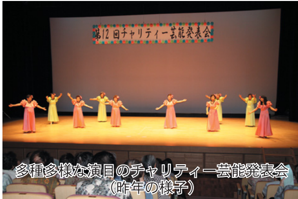
多種多様な演目のチャリティー芸能発表会 (昨年の様子)