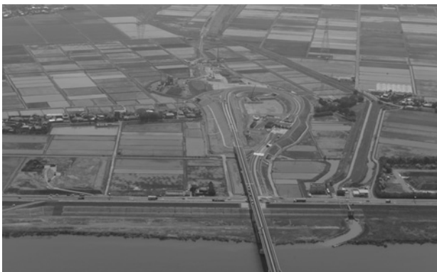
神崎IC 利根川上空より

首都圏中央連絡自動車道(圏央道)は、首都圏の道路交通の円滑化、沿線都市間の連絡強化等を目的とした都心から半径およそ40～60kmの位置に計画されている総延長約300kmの環状の自動車専用道路です。現在までに約170kmが開通しており、平成26年度中は神崎IC～大栄JCTまでの開通が予定されています。