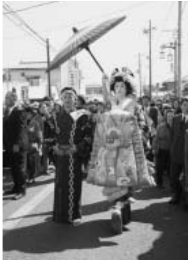
国道は歩行者天国になります

関東で最大級の酒蔵まつり「発酵の里こうざき酒蔵まつり2014」を3月16日⑩に開催します。300年以上の伝統をもつ2軒の酒蔵、鍋店(株)と(株)寺田本家を結ぶ街道が歩行者天国となり、多くの来場者で埋め尽くされます。酒蔵見学や無料試飲のほか、当日限定のお酒も販売されます。仮設ステージでは、バンド演奏やダンスなどを行います。