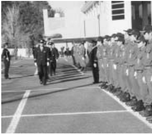
表彰受章者 (順不同、敬称略)

また、成田市消防本部のはしご車、照明車、ポンプ車の展示・実演が行われ、成田市消防音楽隊による演奏や、赤十字奉仕団による豚汁、災害用炊出米飯の無料配布も実施され、多くの一般町民の方もお越しになりました。