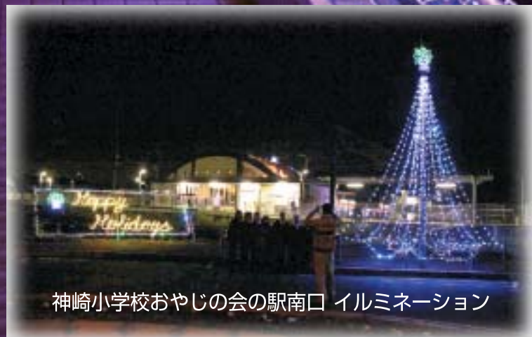
神崎小学校おやじの会の駅南口 イルミネーション

おもな内容 ○町職員の給与等のお知らせ.....P2~ ○神崎ステーションホールイルミネーション...P7