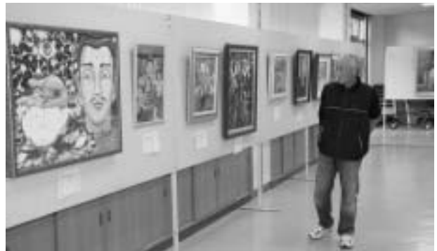
大作も多数出展された 絵画部(作品展示会)