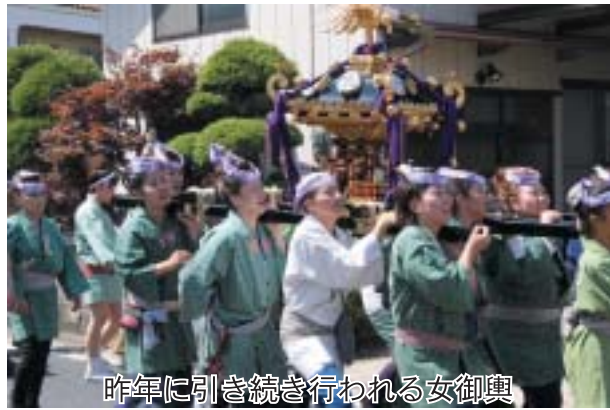
昨年引き続き行われる女御輿