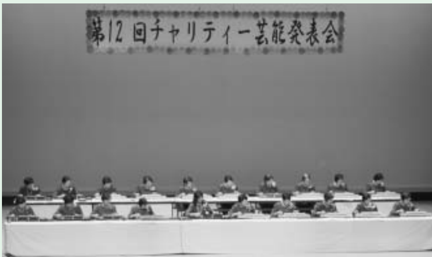
哀愁漂う音色が特徴の大正琴の演奏

6月2日、神崎ふれあいプラザを会場として第12回チャリティー芸能発表会が開催されました。