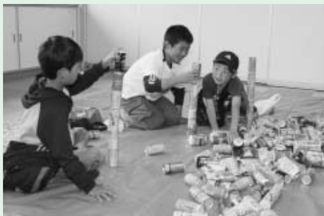
高く積むのは意外に難しい空き缶積み

5月26日、たくさん子どもたちが集まった子ども会お楽しみ会が開催されました。会場のふれあいプラザには、ヨーヨー釣りやペットボトルボウリングなどのゲーム、お菓子やホットドックなどの食べ物が用意され、チケットを手にした子どもたちは思い思いに会場を回って、楽しい半日を過ごしました。