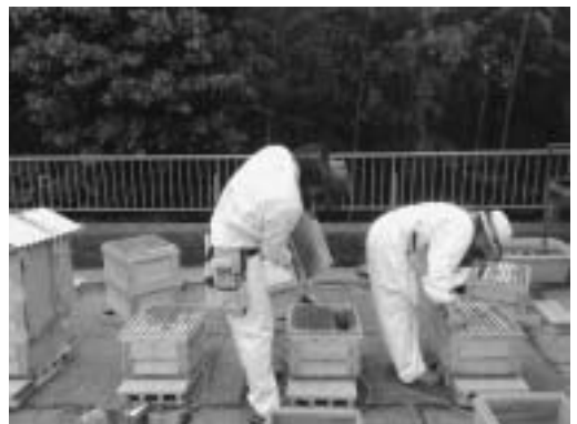
巣箱から蜂の巣を取りだし、ハチミツを採取します。

養蜂は、蜜蜂が花の蜜を集めてくれなければ成り立ちません。たくさん蜜を集めるためには、多くの花が必要です。蜂を育てることは自然を育てることにつながります。養蜂が神崎町の自然を守る手助けとなります。