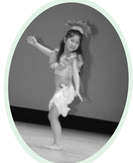
タヒチアングダンスを踊る少女