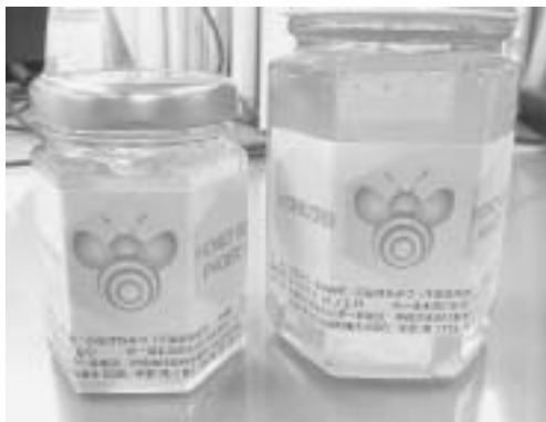
淡い色合いが特徴の神崎産ハチミツ