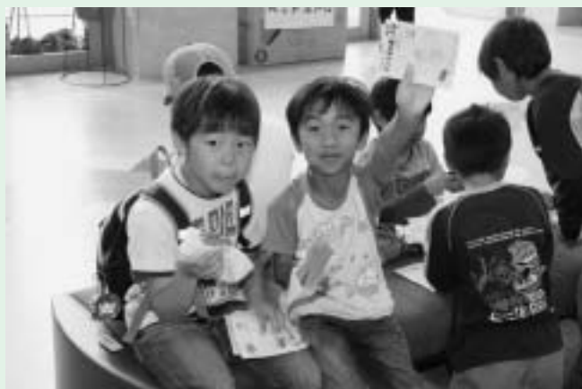
出来たてのホットドック、おいしいよ！