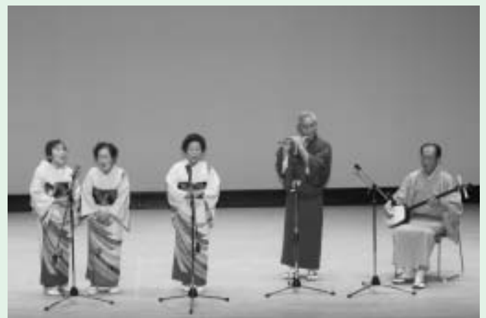
横笛と三味線の伴奏で自慢の民謡を披露