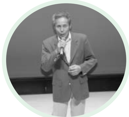
歌い込んだ渾身の1曲を熱唱

なお、発表会の参加料や募金等から、186,471円を神崎町社会福祉協議会へ寄付しました。