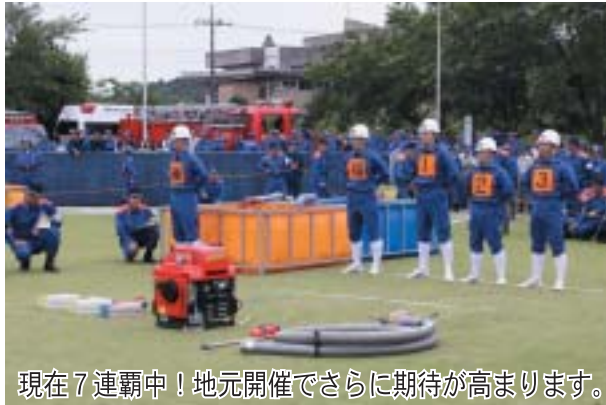
現在7連覇中！地元開催でさらに期待が高まります。