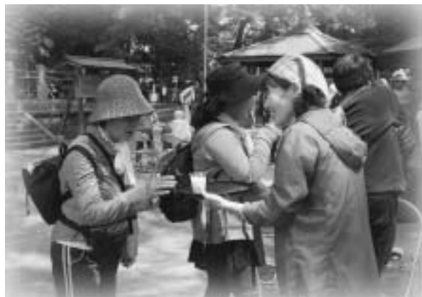
冷たい甘酒でほっと一息