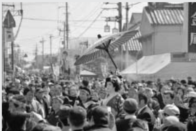
最優秀賞「群衆の華」

コンテストには79点の応募があり、その中から最優秀賞以下43点が選出されました。受賞作品はどれも力作ぞろいで酒蔵まつりの盛り上がりを行彷彿とさせました。