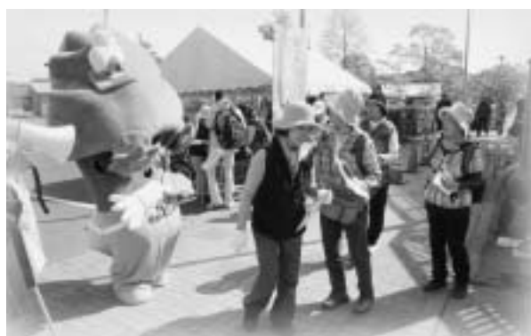
スタートする参加者を なんじやもんがお見送り