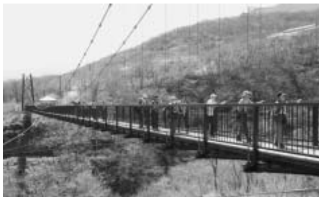
高さ38mのつつじ吊橋からの眺めは最高