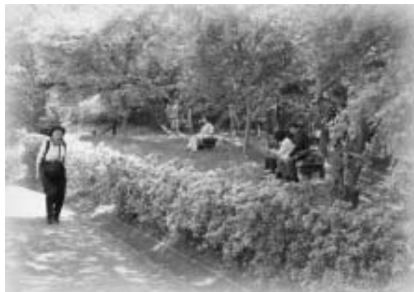
並木遊歩道の木陰で一休み

当日は天候にも恵まれ絶好のハイキング日和となり、参加者は下総神崎駅を起点・終点とする約11kmのコースをのんびり散策しました。コース周辺では地元団体による飲食のおもてなしのほか、地元特産品の販売も行われました。