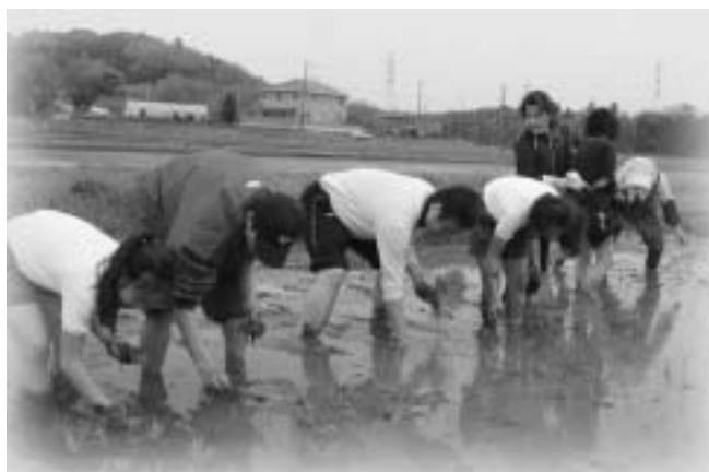
校長先生も一緒に田植えをする米沢小5年生

米沢小の子どもたちも機械での田植え風景は見慣れています。自分たちが手で田植えをするのはほとんどが初体験。農作業の大変さを実感しました。