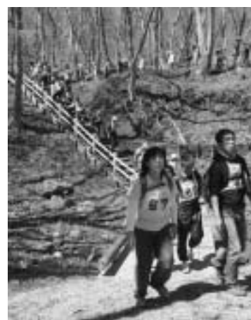
高原の小道をのんびり散策

前日までの雨で開催が危ぶまれましたが、当日は晴天となりハイキングには最高の天気となりました。高原の清々しい空気の中、参加者はのんびりと散策。残念ながらつつじはまだつぼみで、花を觀賞することはできませんでしたが、コースの終盤では吊橋からの絶景を楽しめました。吊橋を渡るときには大きく揺れてスリル満点。橋を渡った人たちは歓声を上げていました。