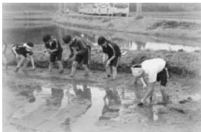
貴重な食育学習を体験する都内の中学生