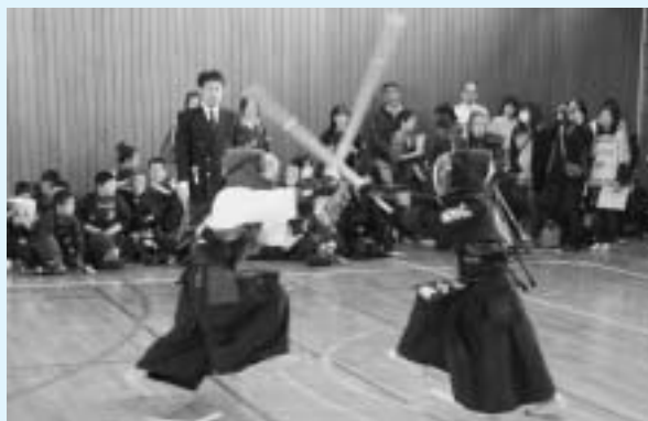
小学生剣士も負けずに 気合の真剣勝負