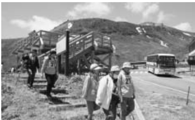
雪が残る那須岳を眺めてスタート