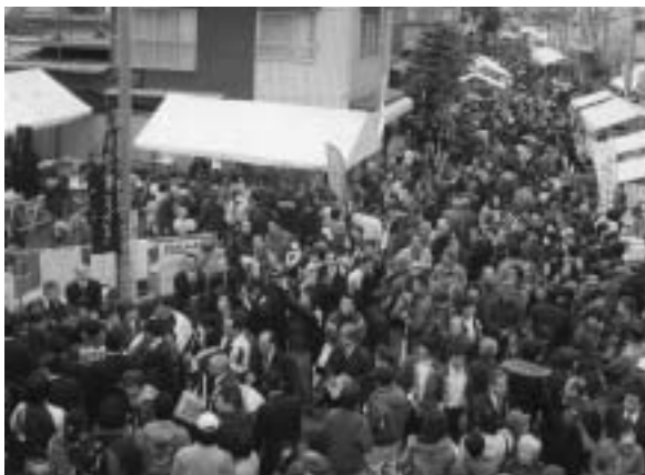
国道は歩行者天国になります

そして、沿道には約200店の 地域物産や発酵食品をはじめとし た露店が並び商店街と一緒に祭り を盛り上げます。 当日、新たに誕生した町のマス コットキャラクター「なんじゃも ん」が、皆さんの前に初登場する 予定です。 ご家族で一日ゆっくり遊べます。 ご来場をお待ちしています。