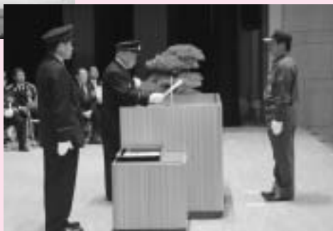
町長から表彰される受賞者