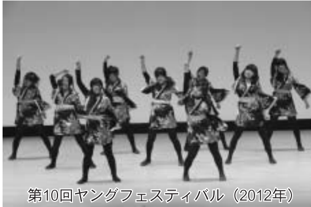
第10回ヤングフェスティバル (2012年)