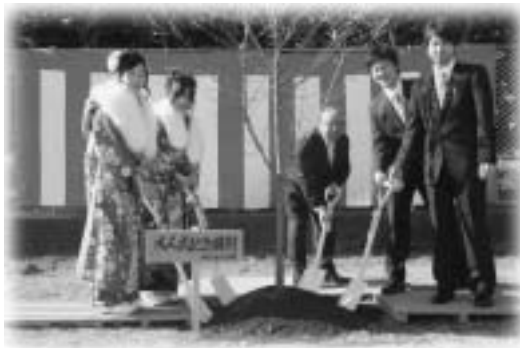
町民野球場での記念植樹