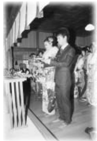
神事での玉串奉奠 たまぐしほうてん