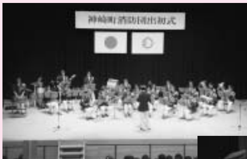
式典に花を添えた 成田市消防音楽隊