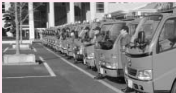
整列した各分団の積載車