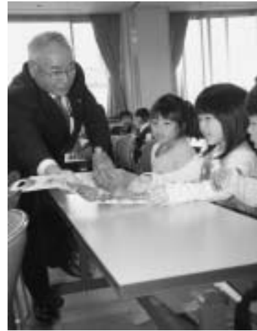
石橋町長より千歳飴を受け取る子ども達