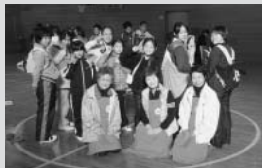
風呂敷2枚でリュックサック