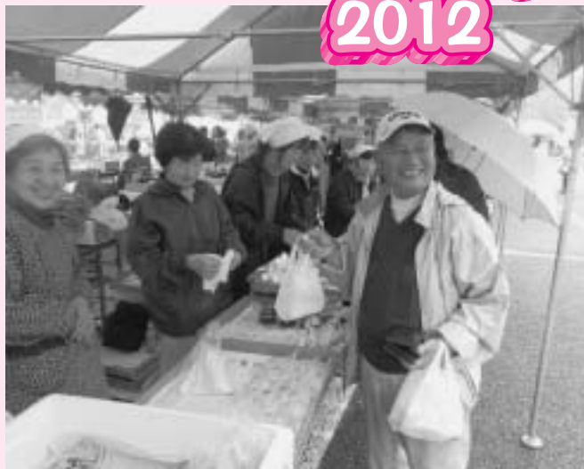
雨の中、多くのお客さんが来場しました

悪天候の中、各出店団体の皆さまには早朝よりご協力いただきありがとうございました。