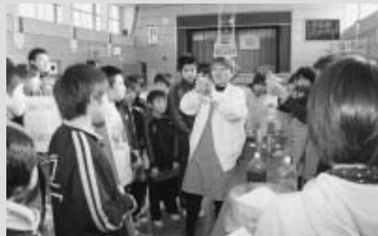
非常食（ハイゼックス）作り