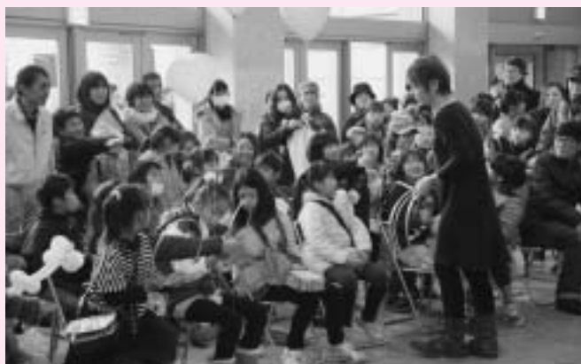
初登場の大道芸人のマジックに大盛り上がり