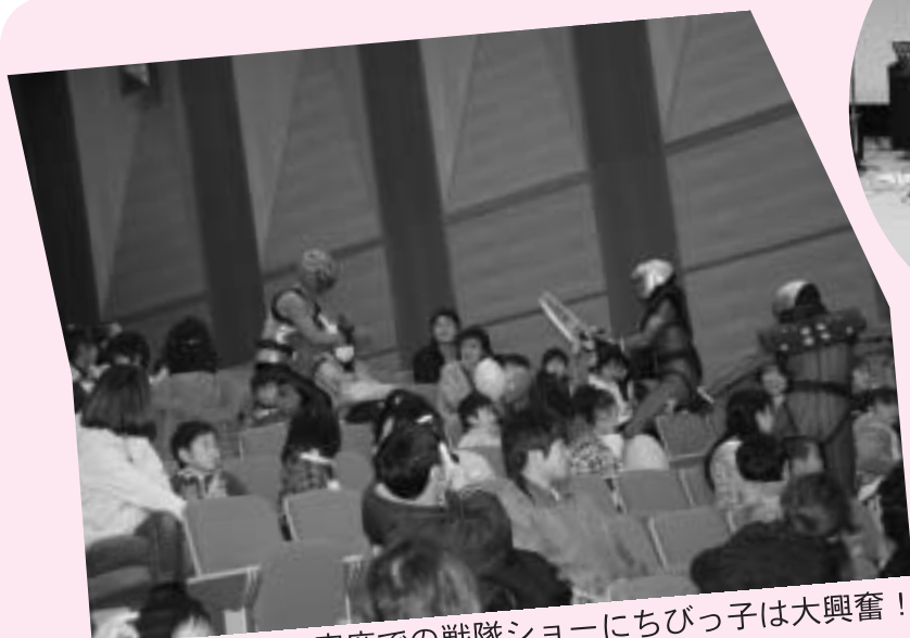
客席での戦隊ショーにちびっ子は大興奮！