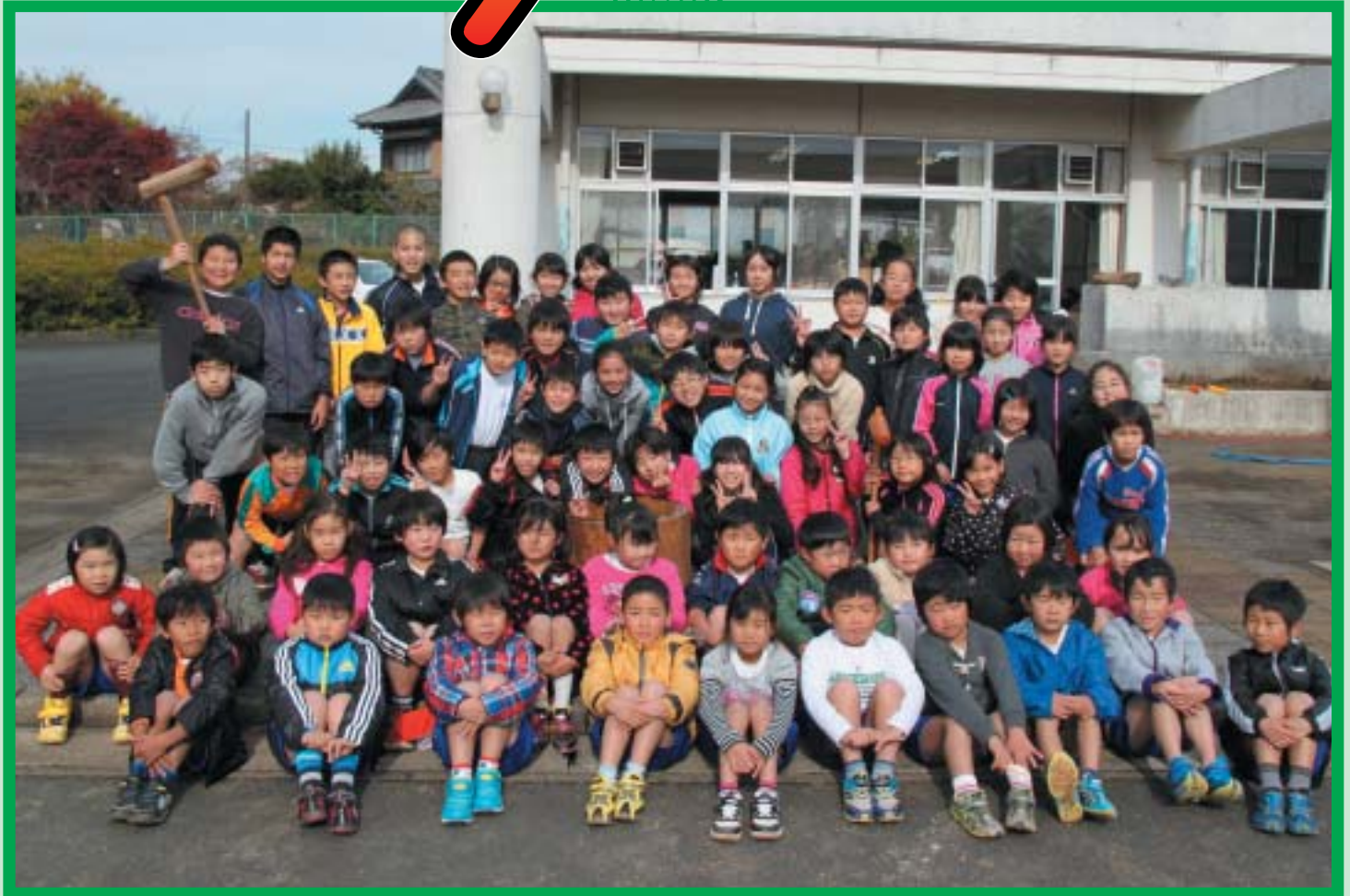
(米沢小学校全校児童65名による餅つき大会)