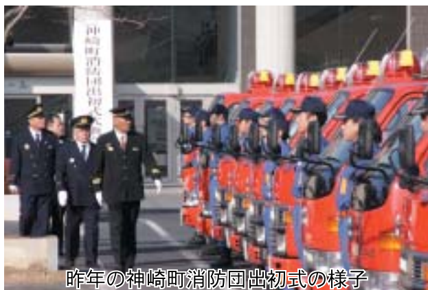
昨年の神崎町消防団出初式の様子