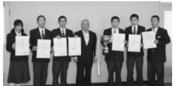
石橋町長に優勝報告する陸上部員