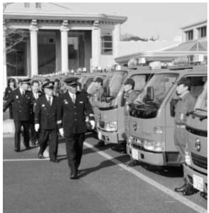
大竹消防団長を先頭に機械器具点検が行われる