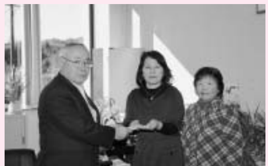
立正佼成会佐原教会長から町長へ