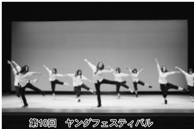
第10回 ヤングフェスティバル