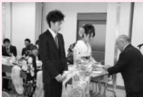
町長より記念品の贈呈