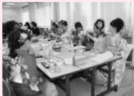
二十歳を祝し乾杯！