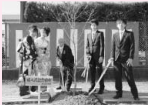
花の咲くなんじゃもんじゃの木を町民野球場に記念植樹