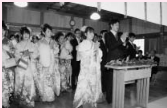
神崎神社で二十歳の誓い

新成人たちは成人となった喜びと希望に満ちあふれ、また、旧友や恩師と談笑したり、写真を撮りあったりするなど、笑顔の絶えない一時を過ごしました。