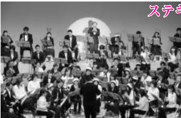
佐原ウインドアンサンブルと神崎中吹奏楽部とのジョイント演奏