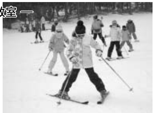
みんな並んで練習です

スキーに慣れた2日目は、各班で自由にゲレンデを滑り、歓声を上げながらスキーを楽しんでいました。