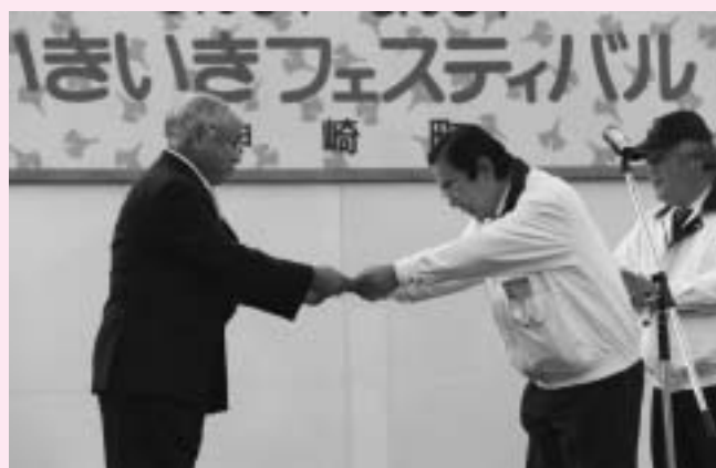
町民まつり閉会式で純陽宮代表から町長