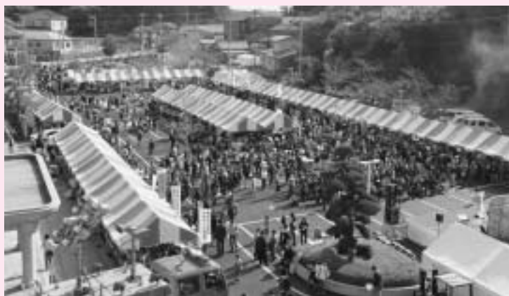
大勢の入場者で賑わいました。