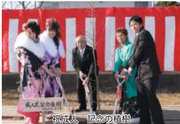
祝成人 記念の植樹