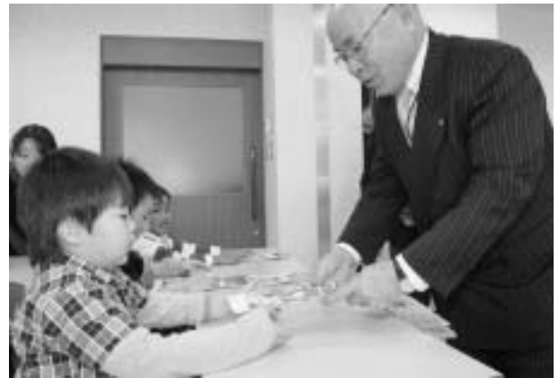
町長から千歳飴とクレヨンが贈られました。