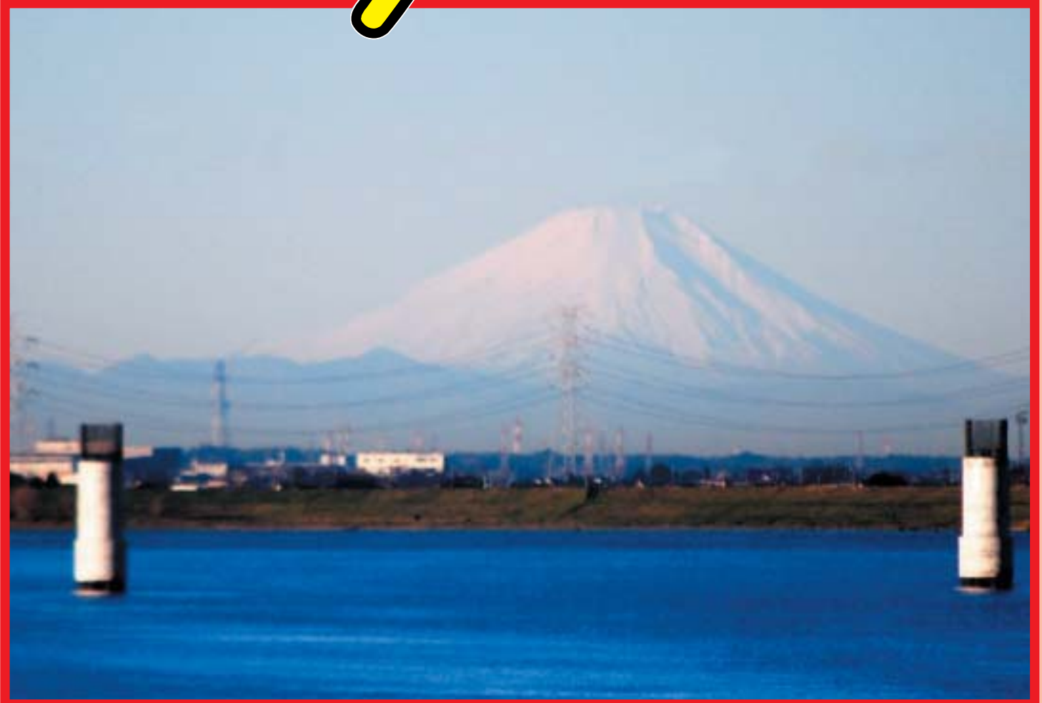
神崎大橋からの富士山（手前は平成25年開通の圏央道の橋脚） 平成22年12月撮影