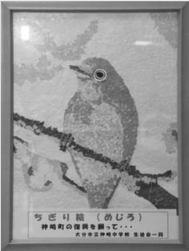
春の桜を背景に未来を見据えるめじろを表現