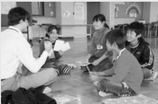
カードを使って、英会話の勉強です。