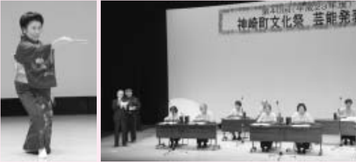
多彩な芸能が披露された芸能発表会

26日には町民音楽祭、30日には芸能発表会が行われ、日頃の練習の成果を発揮する演奏や発表が披露されました。また、11月3日～11月6日にかけて、数々の優れた作品が展示された作品展示会や茶道会や今年、囲碁対局が初めて開催され、大勢の方が芸術の秋を堪能しました。