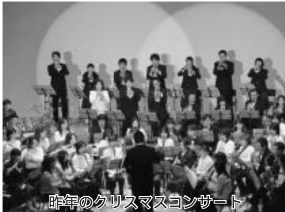
昨年のクリスマスコンサート