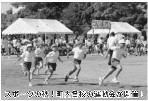
スポーツの秋！町内各校の運動会が開催！