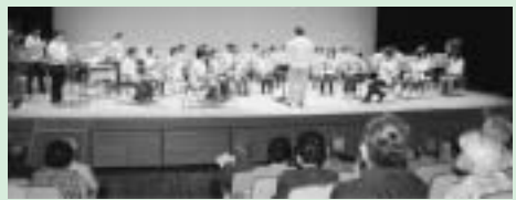
お問い合わせ 町保健福祉課福祉係 72 1603

また、当日は本町でもお馴染みの佐原ウインドアンサンブルによる吹奏楽演奏と、演歌歌手の軽部美智子さんを迎え歌謡ショーを予定していますので、皆さまお誘い合わせのうえ、ぜひご来場ください。