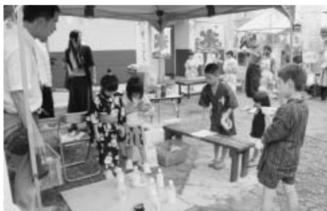
ペットボトル輪投げに挑戦