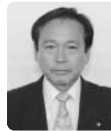
鈴木 仁 議員