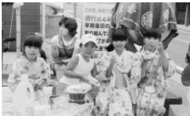
夏はかき氷がおいしいね