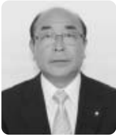
第22代議長 成毛 績 議員