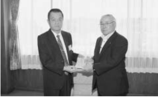
日本大道院純陽宮様から町長へ