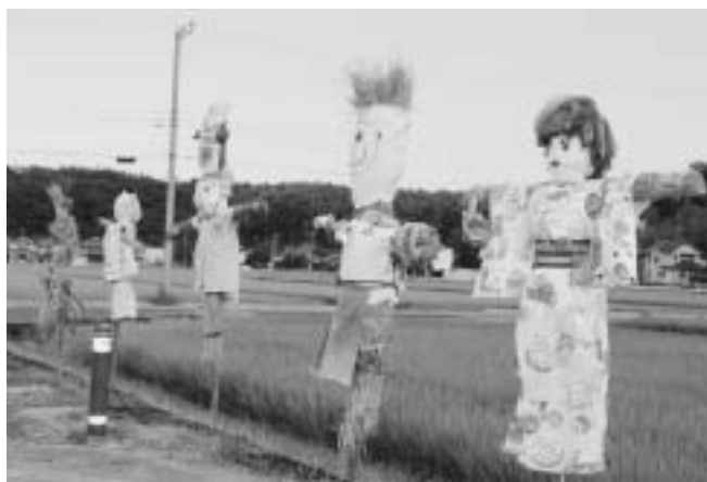
案山子には緑の田んぼに青い空が似合います。

中には、スズメも笑ってしまうような作品や、台風にも負けない力強い作品もあり、9月中旬まで楽しめますので、みなさんもぜひご覧になって、今度は参加してみてもはどうでしょう。