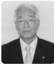
椿 一二 議員