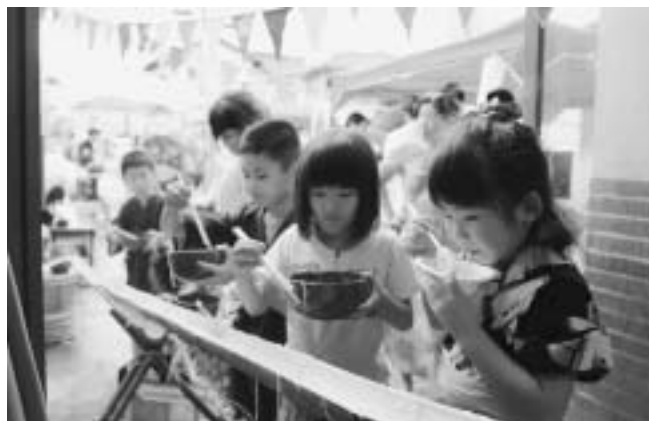
楽しい！おいしい！流しそうめん