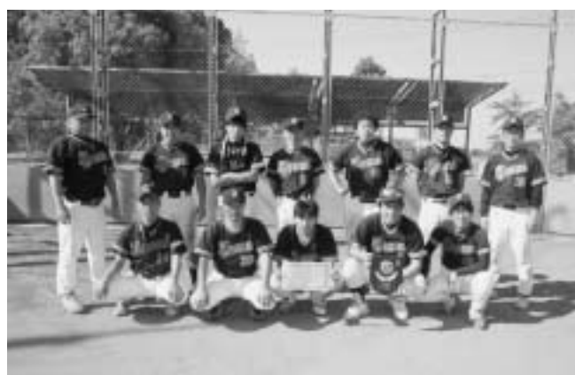
優勝したズームスのメンバー