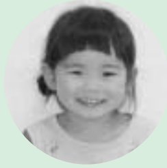
てらだ こころ 寺田 心ちゃん (神崎本宿)