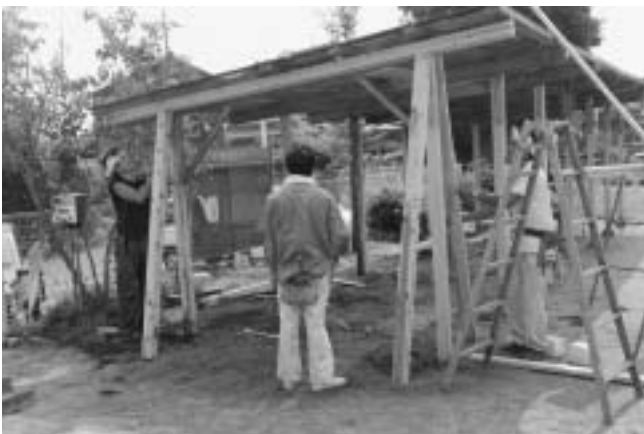
職人の技でみるみるきれいになっています。