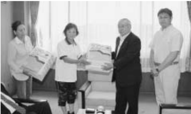
大人用紙おむつ800枚を寄付