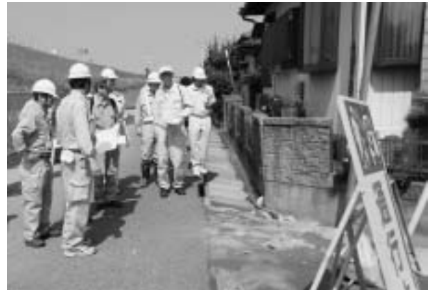
国による道路の災害査定の様子

これから災害復旧に向けて地元説明会を実施しながら道路・水道等、順次工事の発注準備に入ります。