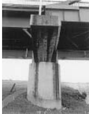
現在の橋脚の様子