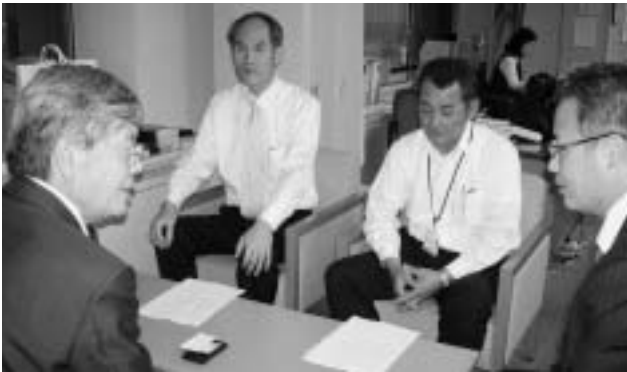
千葉県道路環境課への要望活動