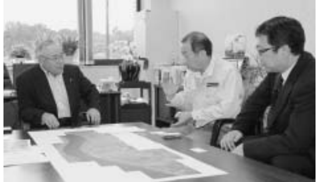
江崎孝参議院議員への要望活動