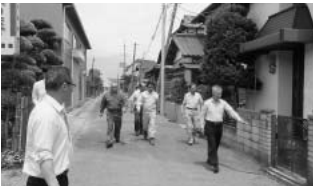
谷田川元衆議院議員の被災現場視察