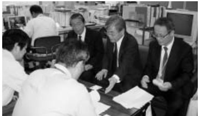
千葉県耕地課への要望活動