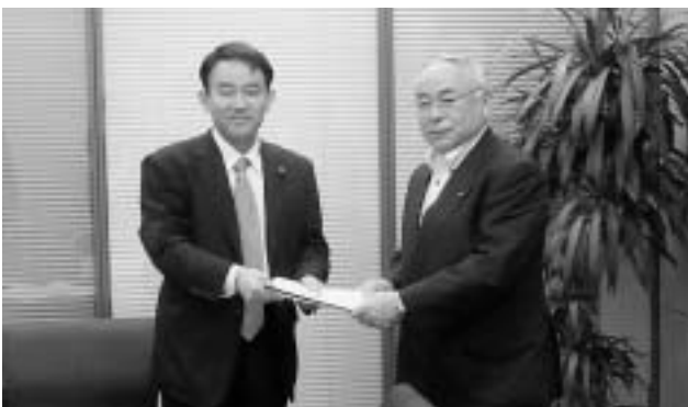
谷田川元衆議院議員への要望活動