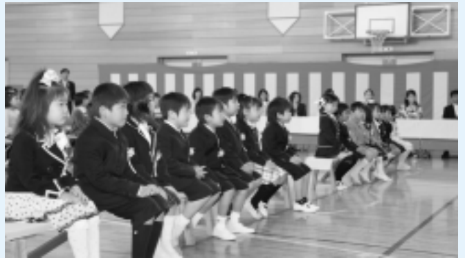
米沢小学校(16名入学)

希望に胸をふくらませ、新しい生活をスタートさせた新入生のみなさん、勉強に、運動にそして友だちと充実した学校生活を送ってください。