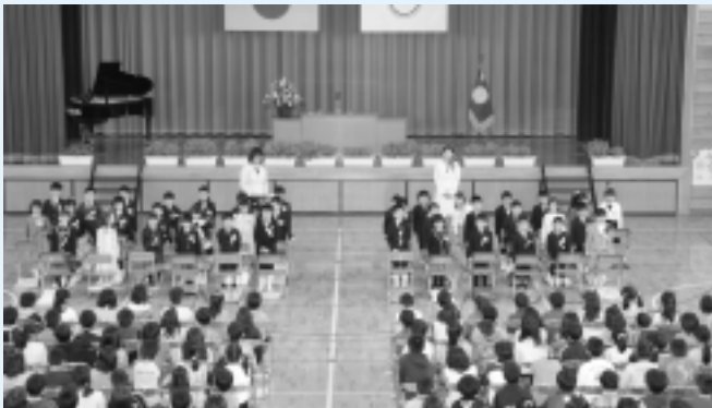
神崎小学校(40名入学)