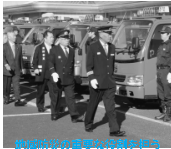
地域防災の重要な役割を担う