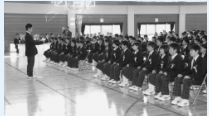
神崎中学校(62名入学)