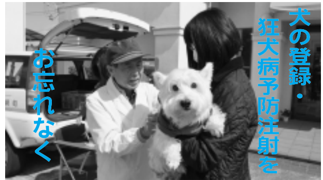
犬の登録・ 狂犬病予防注射を