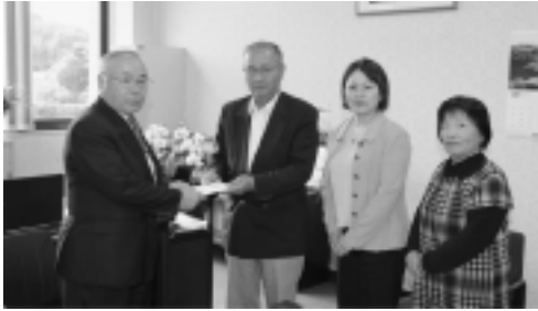
立正佼成会のみなさん (右)から町長へ

3月11日の震災以来、神崎町の復興へ役立てて欲しいと多くのご寄附が寄せられました。有効かつ大切に活用させていただきます。