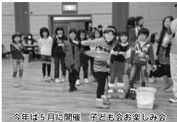
今年は5月に開催 子ども会お楽しみ会