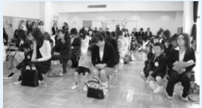
神崎保育所(26名入所)