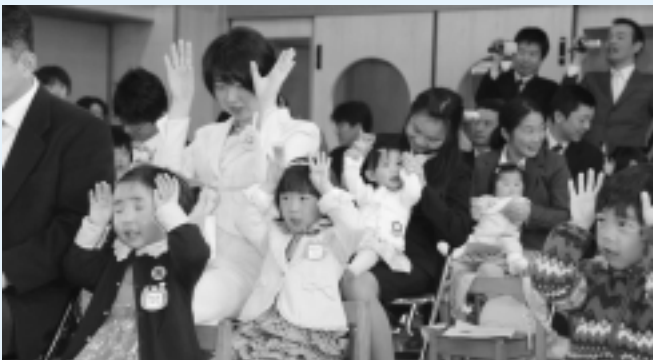
米沢保育所(12名入所)