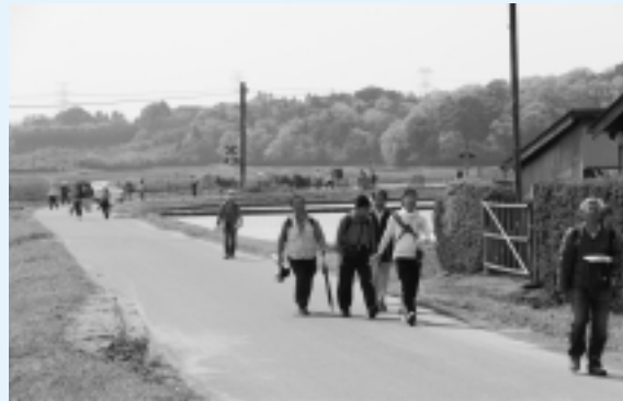
のどかな田園風景を見ながら散策