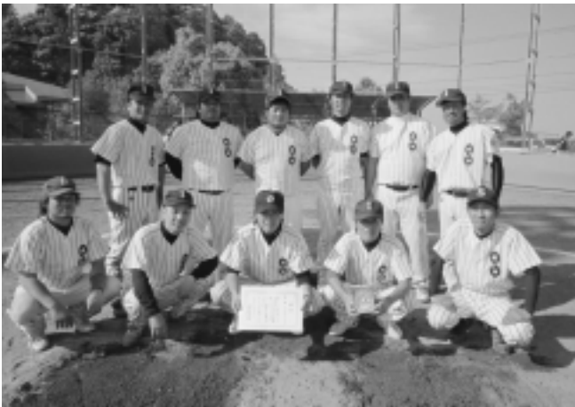
優勝したSLAP SHOTのメンバー