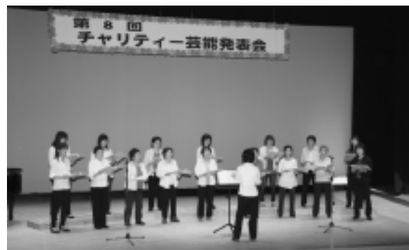
昨年のチャリティー芸能発表会