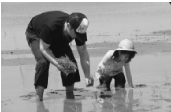
バスで田植えにやってきた160人の中学生が古原地先の水田（写真：上）・お父さんと一緒に田植え体験は神崎神宿地先の水田（写真：下）