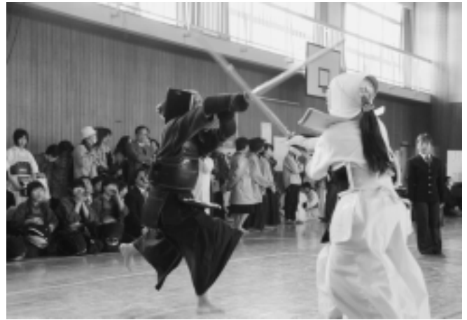
神崎中剣士の気合の打ち込み！

会場は、選手の発する気迫と応援団の声援につつまれ、熱気に満ちた試合が繰り広げられました。