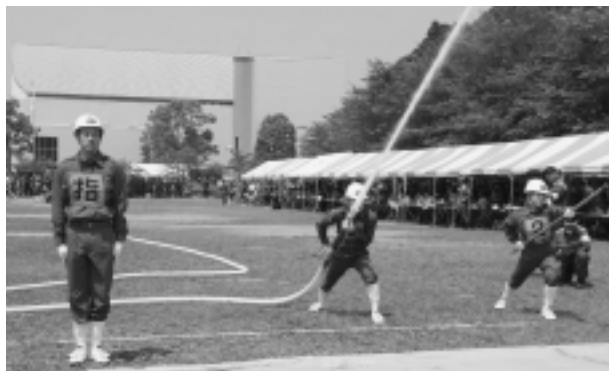
毎日の訓練の成果を発揮するポンプ操法大会