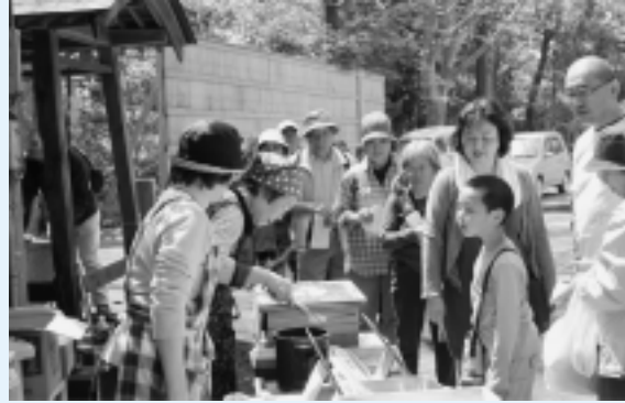
神崎神社でひと休み

参加者は、のどかな田園風景や一面に咲き誇るレンゲの花に心を和ませ、ウォーキングを楽しみました。コース沿いでは休憩所に設けられた飲食のもてなしや地元特産品販売が行われ、さらにゴールの駅での抽選会で、お土産を手にして、神崎での1日を満喫していました。