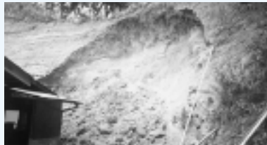
平成4年に小松を襲った土砂災害

近年は、地球温暖化の影響ともいわれる異常気象により、猛烈な集中豪雨に伴う土砂災害で、全国で多くの被害がでています。突然襲う土砂災害に対して、日ごろからの備えが重要になります。町では、「土砂災害ハザードマップ」を作成し、ご家庭に配布していますので、日ごろの備えにご活用ください。