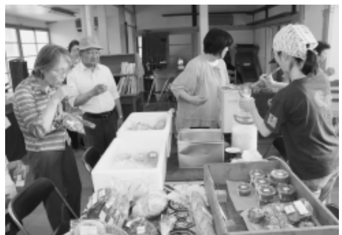
毎週金曜日 16時から19時までオープン