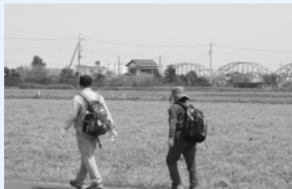
レンゲ畑と神崎大橋を望む