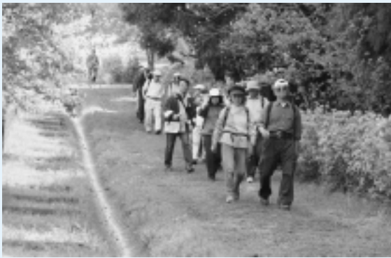
新緑の並木遊歩道を抜けて