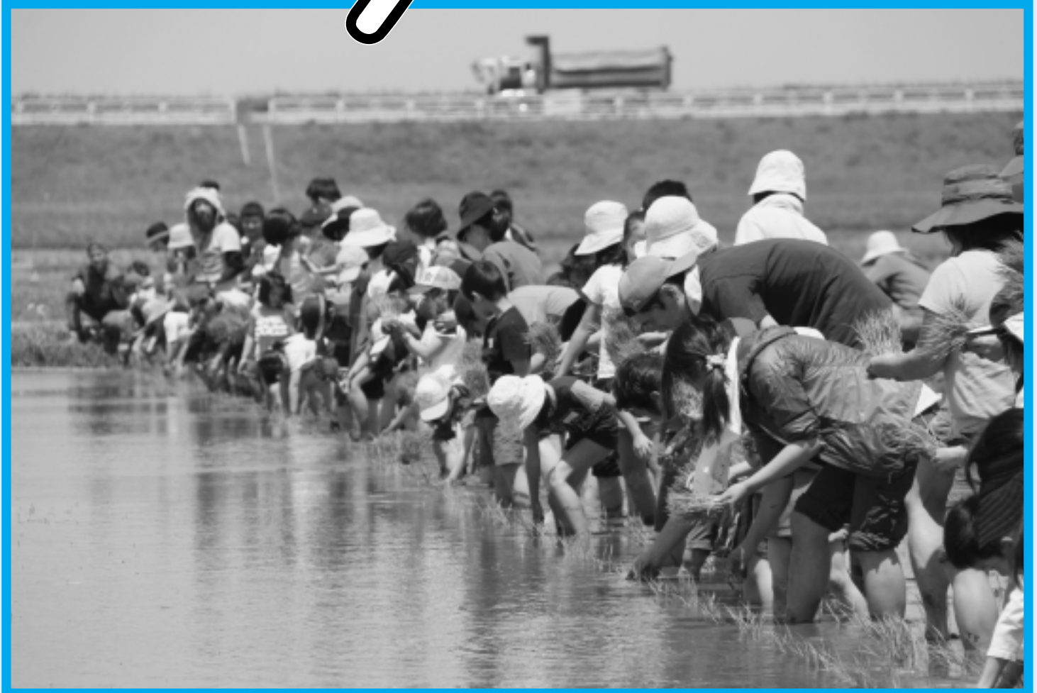
(神崎神宿での田植え体験)