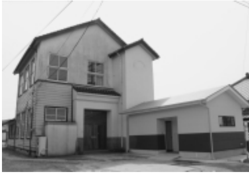
2階は、30年前の雰囲気が味わえます。

旧庁舎本体の改修は、雨漏りの修繕等を実施し、その30年前の雰囲気そのままに、味わえます。