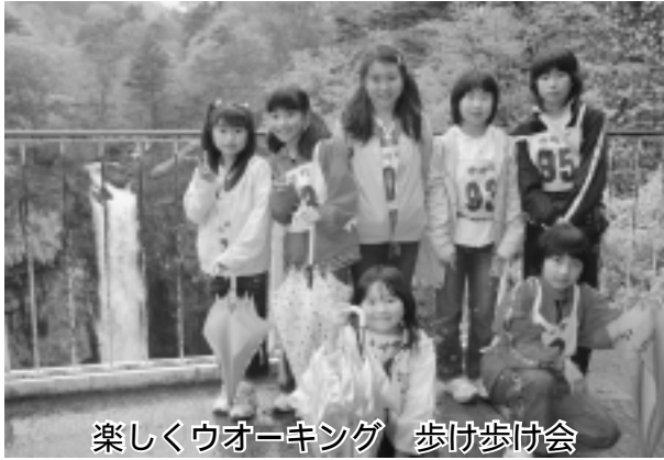
楽しくウォーキング 歩け歩け会