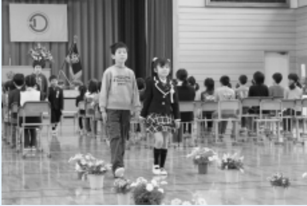
米沢小学校（11名入学）