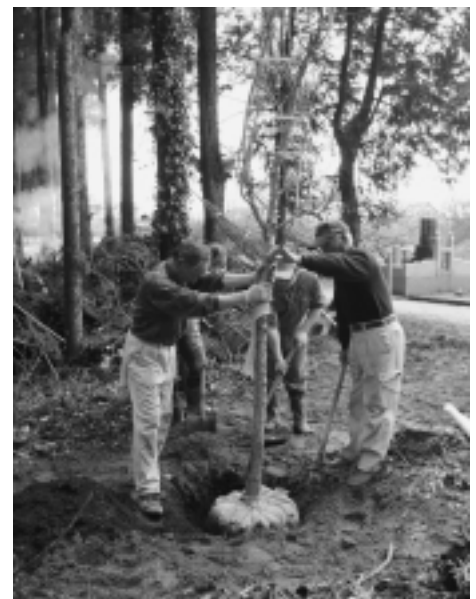
古原（原宿）地区によるヒトツバタゴの植樹

募金の趣旨に賛同して頂いた町民の皆さまには大変感謝しております。また、募金の取りまとめや苗木の植樹を行って頂いた各地区の区長及び世話人の方には大変ご苦労さまでした。