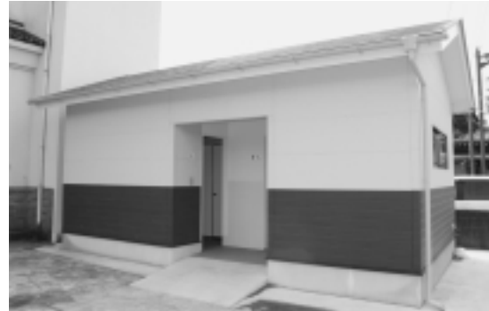
多目的トイレも装備した 水洗トイレ

平成21年度国の補正予算で、地域活性化が速やかに着実に実行されることを目的に、『経済危機対策臨時交付金』と『きめ細かな交付金』が創設され、本町でも様々な事業に取組みま