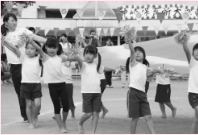
バルーン「ほたるのひかり」