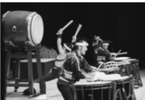
エネルギーッシュな演奏で観客を魅了した志多らの和太鼓公演