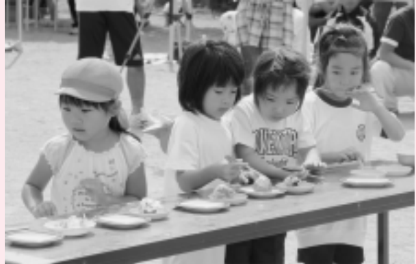
親子競技 今日だけチェンジ