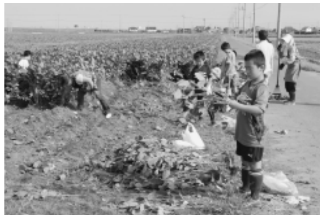
枝豆の収穫を楽しむ人たち

昨年はコスモスが満開に咲き誇り、今年は「枝豆を収穫体験してもらおう。」と町内の小学校に呼び掛けました。10月4日～10月12日の期間、家族や友達が続々と集まり、たくさんの実を付けた大豆を収穫しました。自宅に帰って「食べるのが楽しみです。」と話していました。