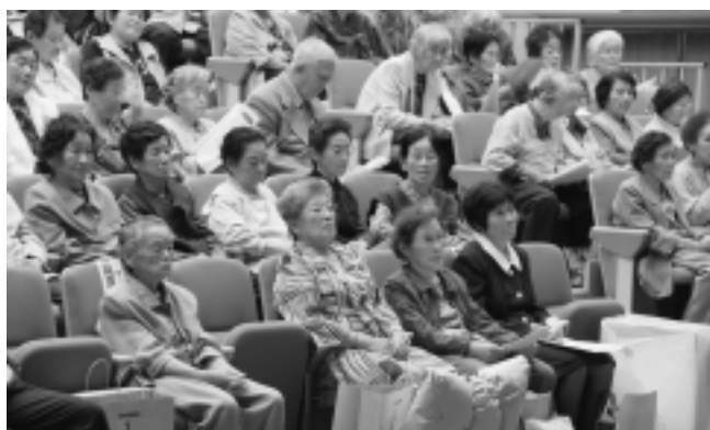
いつまでもお元気で！