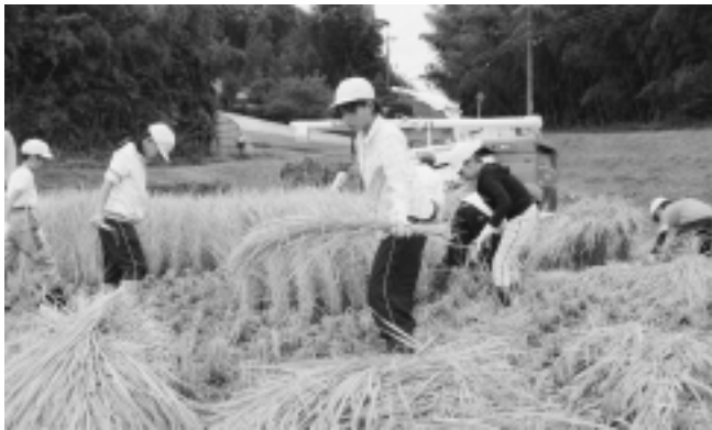
稲の刈り取り作業に汗を流す児童たち