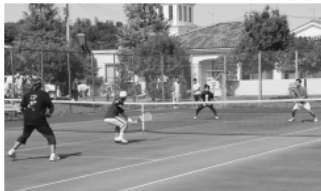
11回目を迎えた神崎町オープンテニス大会