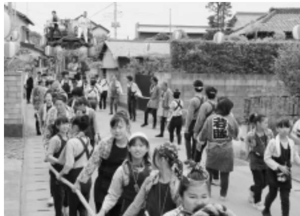
◀ 佐原ばやしに奏でられ、多数の人が参加した山車の引き廻し

特に7月18日～20日にかけて、神崎本宿地区の祇園祭では、御神輿のや山車の曳き廻しが行われ、大勢の見物客で賑わいをみせました。